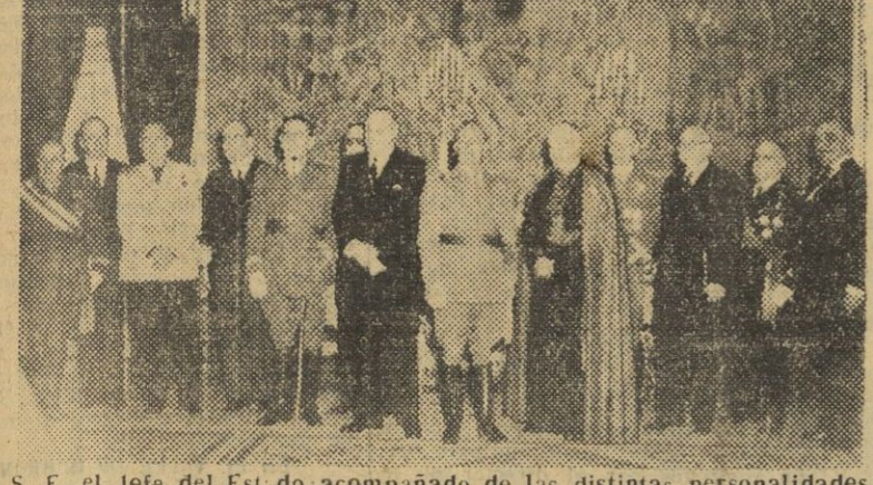
S. E. el Jefe del Estado acompañado de las distintas personalidades que componen el Consejo del Reino, presididos por don Esteban Bilbao, que acudieron al palacio de El Pardo para felicitarle con motivo de Año Nuevo.

MADRID, 7. — A mediodía de ayer acudieron al palacio de El Pardo los consejeros del reino, presididos por don Esteban Bilbao, quienes felicitaron a Su Excelencia el Jefe del Estado, con el cual estuvieron reunidos largo rato.