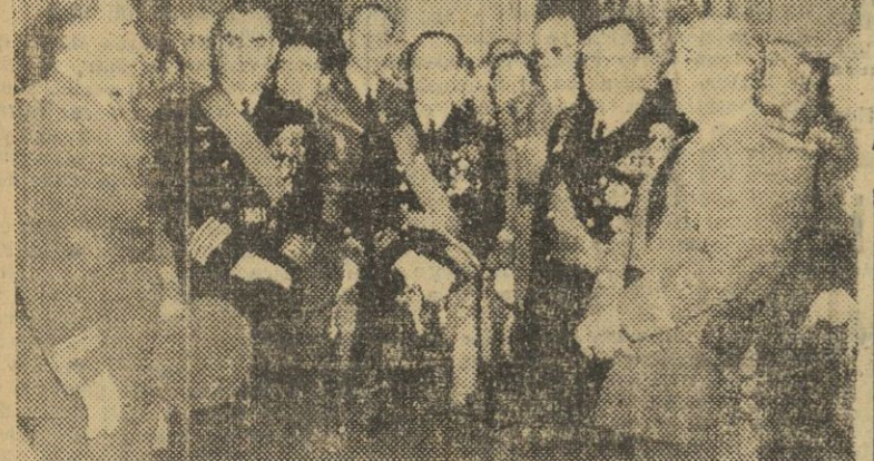
S. E. el Jefe del Estado recibió en el palacio de El Pardo a una Comisión de generales de los tres Ejércitos que, presididos por el ministro del Ejército, teniente general Muñoz Gra des, le felicitó con motivo de la Pascua Militar.

MADRID, 7. — Los Ejércitos de Tierra, Mar y Aire, han celebrado ayer la Pascua Militar en Madrid y provincias, con las tradicionales visitas a los generales y jefes en situación de reserva que cuentan más edad entre los de su categoría, a quienes han ofrecido el homenaje de sus compañeros en activo.