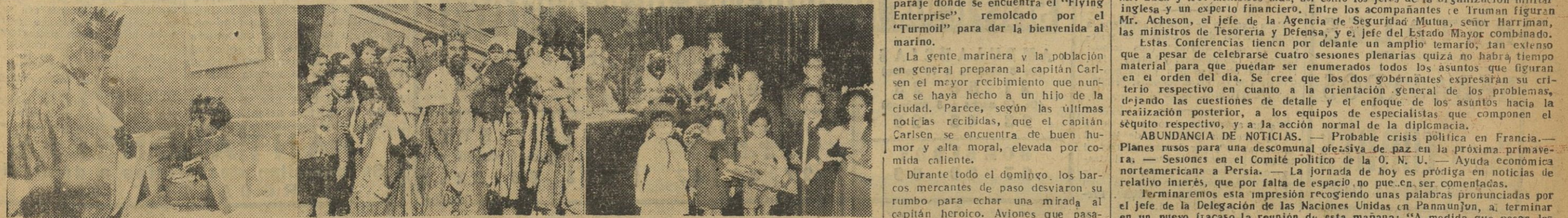
Sus Majestades los Reyes Magos de Oriente llegaron con el pasado sábado, por la tarde, a Barcelona, obsequiando especialmente a los niños. He aquí la visita que realizaron al Hospital Clínico, a una importante industria barcelonesa y a la Asociación de la Prensa.