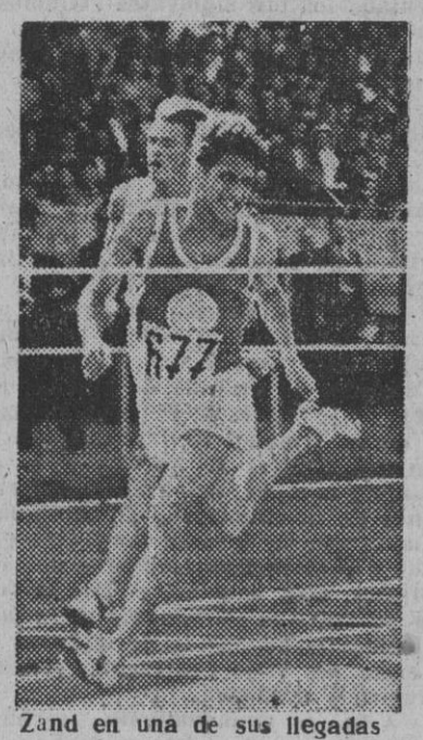
Zand en una de sus llegadas