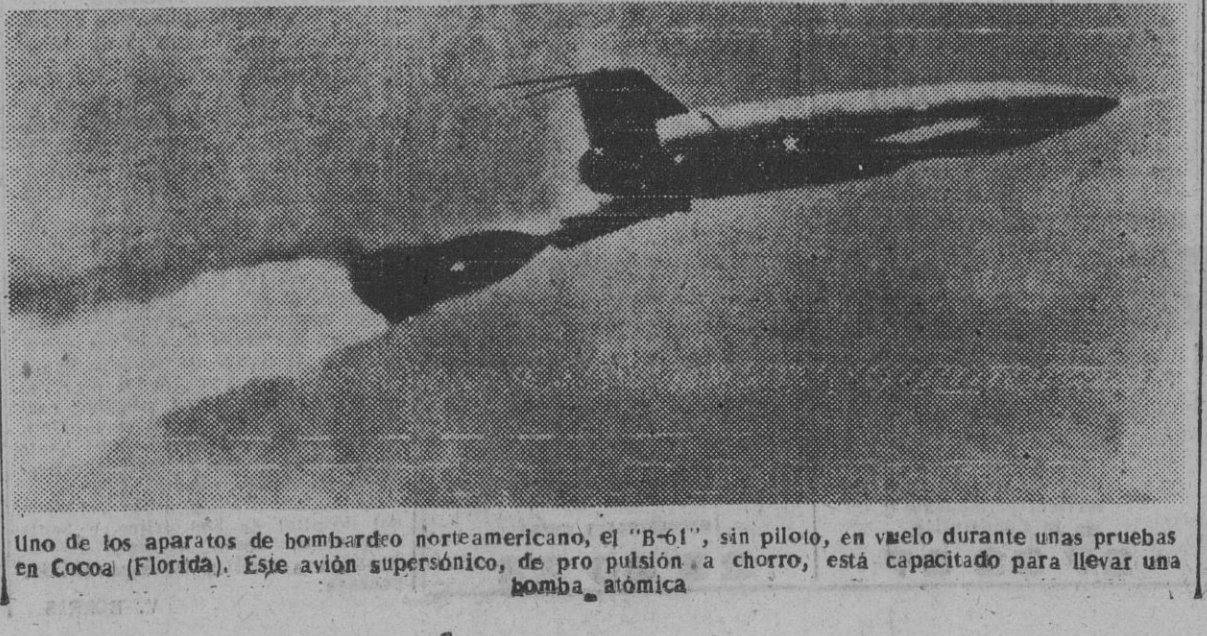
Uno de los aparatos de bombardero norteamericano, el "B-61", sin piloto, en vuelo durante unas pruebas en Cocoa (Florida). Este avión supersónico, de propulsión a chorro, está capacitado para llevar una bomba atómica.