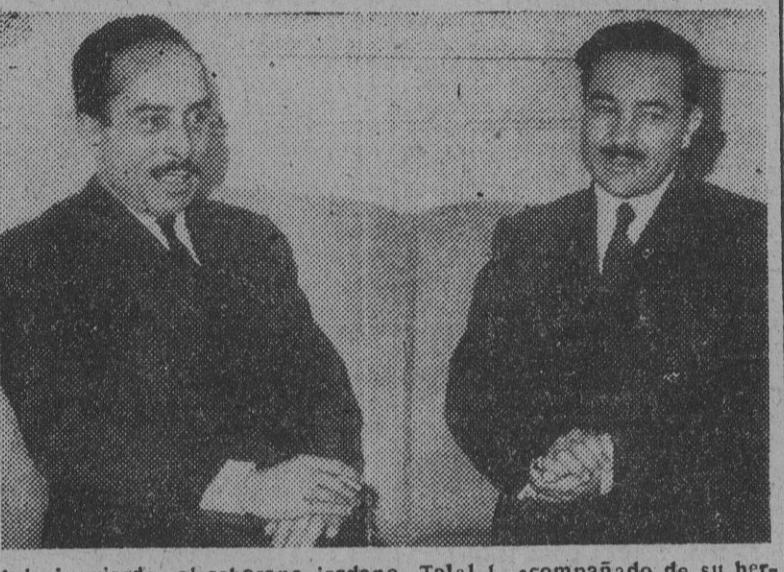
A la izquierda, el soberano jordano, Talal I, acompañado de su hermano el príncipe regente Naif, fotografiados antes de tomar el avión que les conduciría a Amman, donde Talal prestó juramento como rey de Jordania.