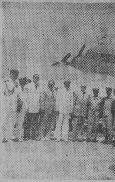
Los cadetes de la Aviación italiana a su llegada al Aeropuerto del Prat, con las autoridades que acudieron a darles la bienvenida.