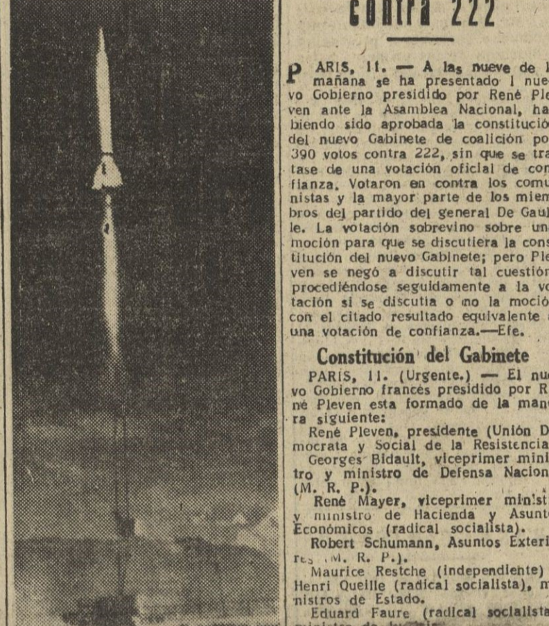
El cohete americano «Viking», de cinco toneladas, se eleva al cielo durante unas pruebas realizadas en White Sands, Nuevo México. El cohete alcanzó una altura de 135 millas y una velocidad de más de 1.400 millas por hora durante sus diez minutos de vuelo.

Pruebas con un nuevo cohete norteamericano