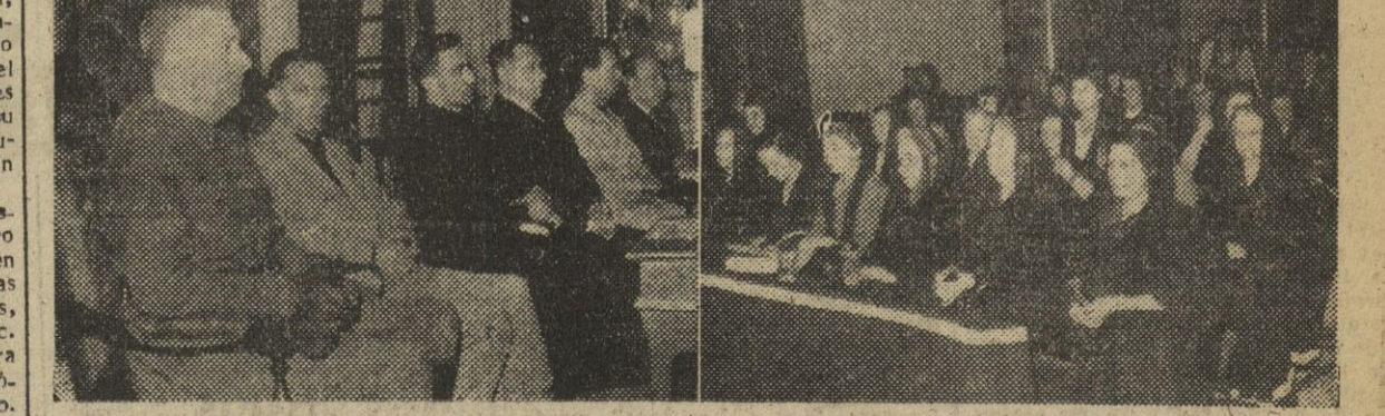
Autoridades y jerarquías en la presidencia de los solemnes funerales celebrados por los Mártires de los Fosos de Santa Elena. Familiares de los Mártires en el acto.

Funerales por los Mártires de los Fosos de Santa Elena