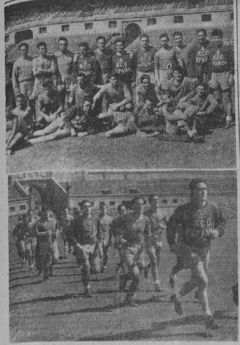
Esta mañana, en el Estadio de Montjuich, el R. C. D. Español inició sus entrenamientos oficiales ante la próxima temporada...