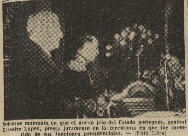
Solemne momento en que el nuevo jefe del Estado portugués, general Craveiro Lopes, presta juramento en la ceremonia en que fue investido de sus funciones presidenciales.

Craveiro Lopes, jefe del Estado portugués