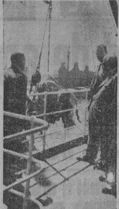
El capitán del "John Lykes", el cónsul general de los Estados Unidos, Mr. Brown...