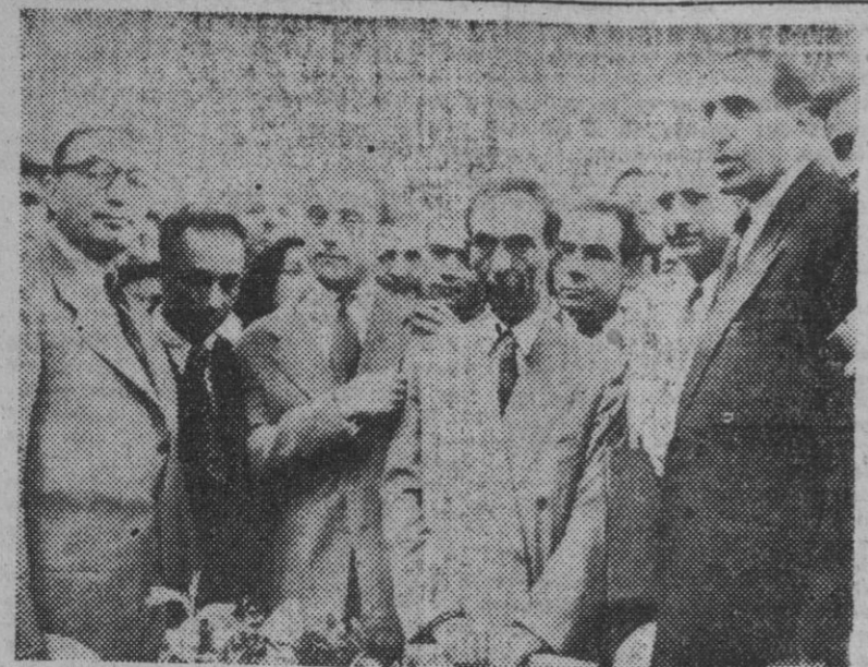
Un grupo de expertos petrolíferos persas han salido de Teherán para incautarse de los pozos de la Anglo-Iranian. Tropas suficientes les acompañan para evitar desórdenes.