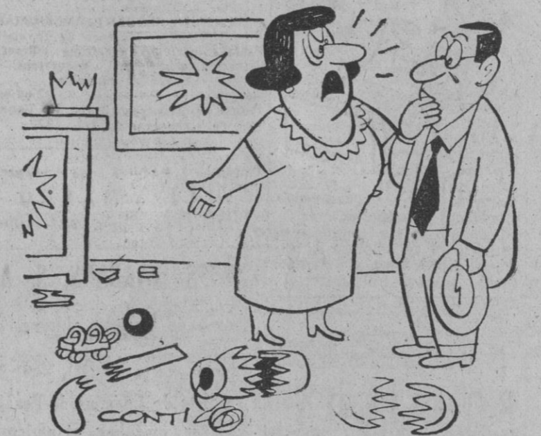
— ¡Cómo se te ocurrió llevar el chico a ver los Campeonatos de Hockey!