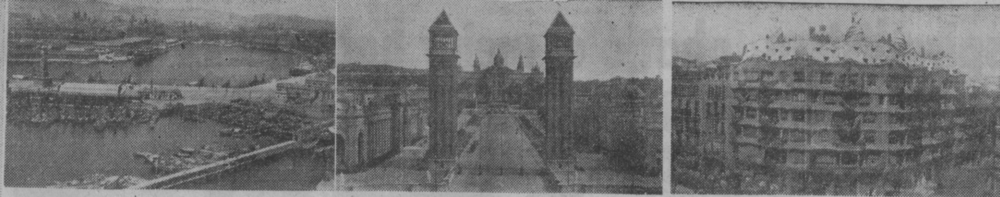
In these photographic panoramas you can see various aspects of his fine Mediterranean city. 1. The Cathedral. — 2. Partial vista of the Port. — 3. Avenida de la Reina María Cristina and in the distance the Palacio Nacional of the 1929 Exhibition. — 4. The famous and very original building «La Pedrera» (Architect Gaudi) and 5. The highest point of Tibidabo.