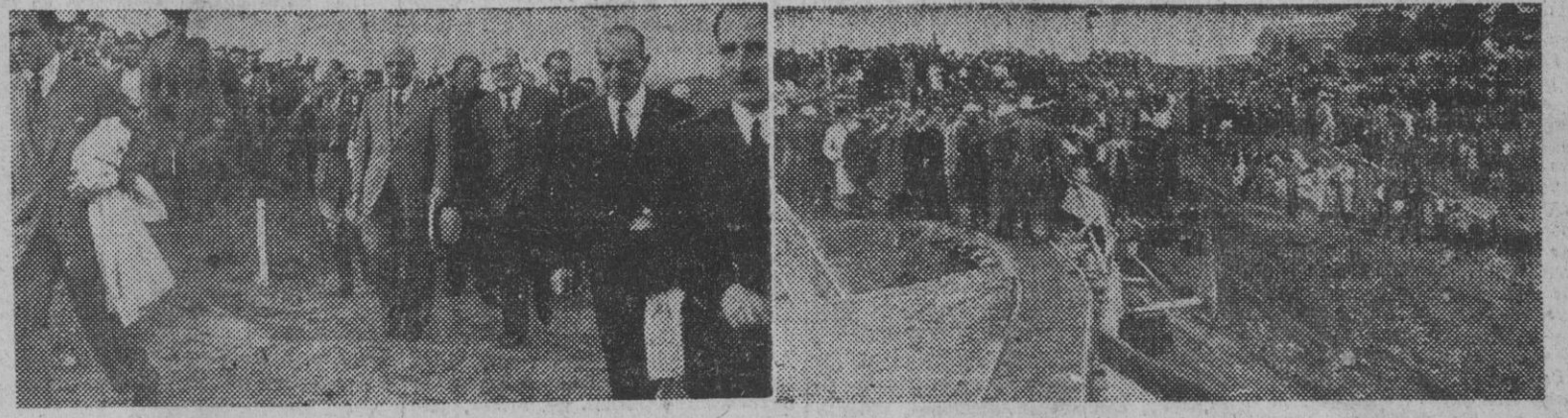
El pueblo de Bailén en masa y trabajadores de la Confederación Hidrográfica del Guadalquivir aguardan la llegada del Caudillo, quien acompañado de los ministros de Obras Públicas, Industria y Comercio y Agricultura, visitó las importantes obras que se llevan a cabo por dicha Confederación. En la siguiente fotografía se recoge un momento de la visita del Caudillo a quien le fue explicado el plan de las obras que en la cuenca minera se realizan.