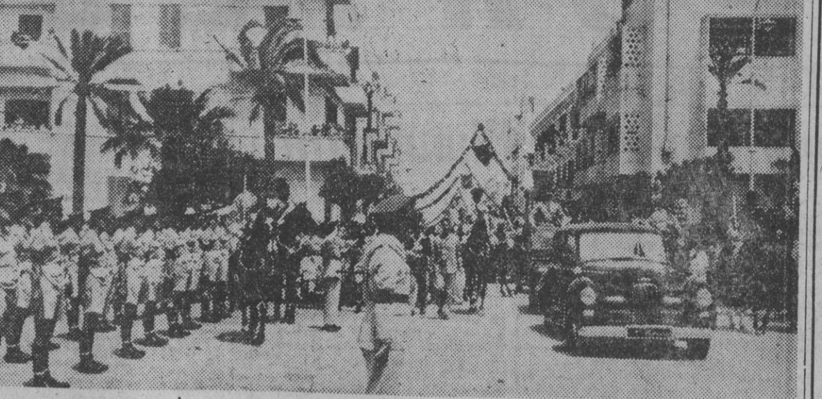
El emir de Cirenaica, designado rey de Libia, a su llegada a Trípoli, por primera vez, el 19 del corriente mes, se dirige en coche hacia palacio. Durante su recorrido en coche explotaron dos bombas, una en su coche, que no hizo daño, y otra en el suelo, hiriendo a cinco espectadores y dos policías.