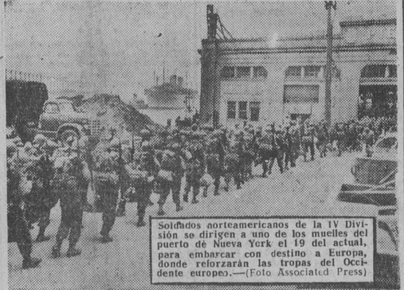
Soldados norteamericanos de la IV División se dirigen a uno de los muelles del puerto de Nueva York el 19 del actual, para embarcar con destino a Europa, donde reforzarán las tropas del Occidente europeo.