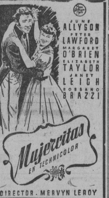
DIRECTOR MERVYN LEROY

La Metro Goldwyn Mayer ha filmado este año una gran película en technicolor, la famosa novela de Luisa May Alcott