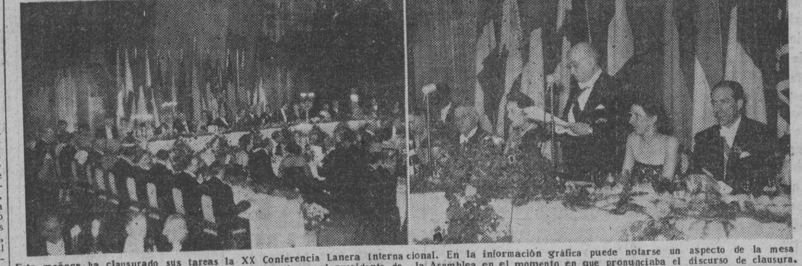
Esta mañana ha clausurado sus tareas la XX Conferencia Lanera Internacional. En la información gráfica puede notarse un aspecto de la mesa durante el banquete que se ha celebrado con tal motivo y al presidente de la Asamblea en el momento en que pronunciaba el discurso de clausura.