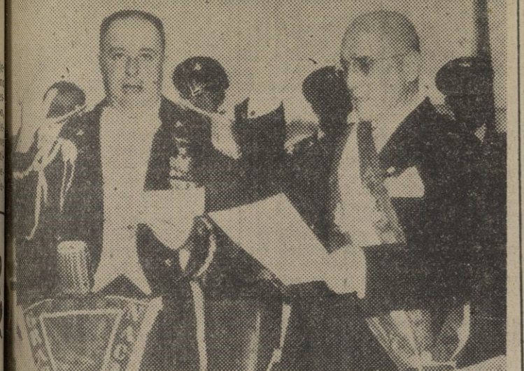
El general don Anastasio Somoza, presta juramento como presidente de Nicaragua. A la derecha el presidente del Congreso, don Mariano Argüello, toma juramento al presidente.

Prisamiento del nuevo presidente de Nicaragua