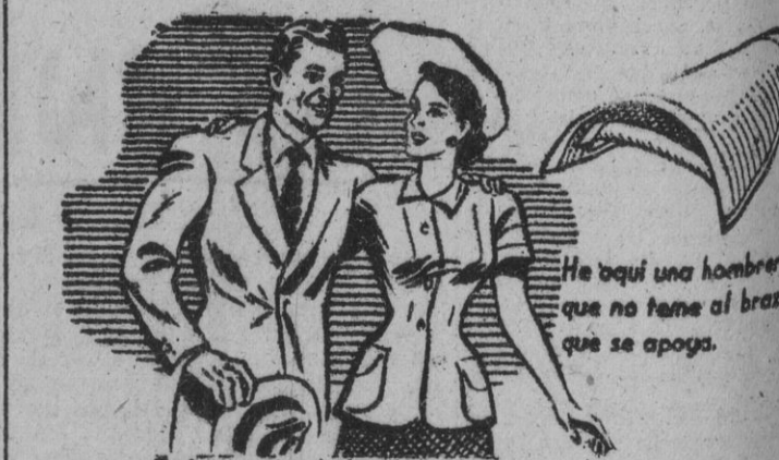
He aquí una hombre que no teme al brazo que se apoya.