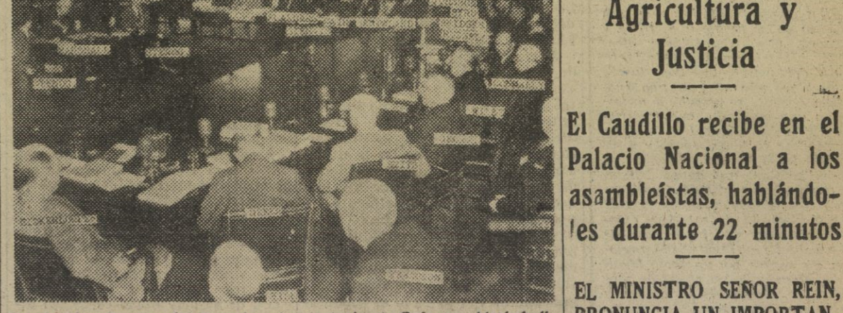
En el salón Caucus del Senado, el secretario de Defensa, Marshall, hace sus declaraciones desmintiendo al general Mac Arthur, ante los Comités senatoriales de Servicios Armados y Asuntos Exteriores

Marshall desmiente las declaraciones de Mac Arthur