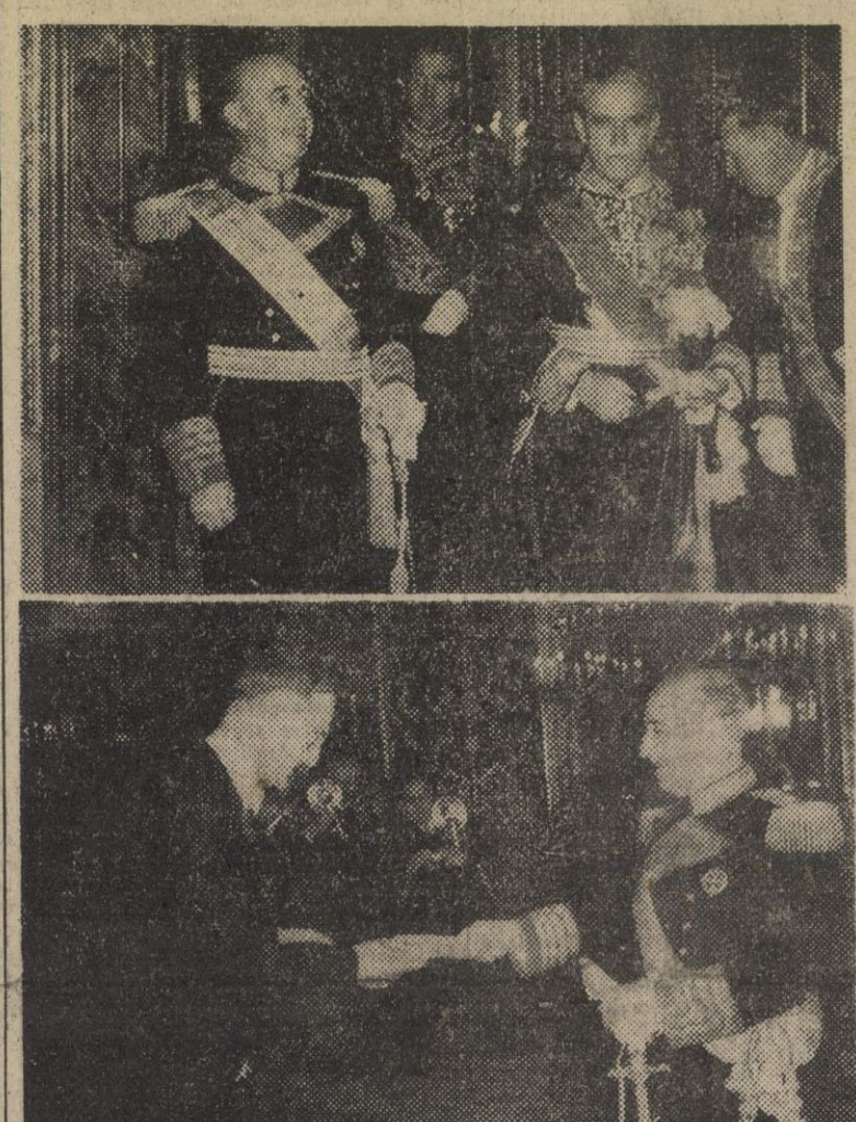
En la primera fotografía S. E. el jefe del Estado, acompañado del ministro de Asuntos Exteriores, con el embajador de Bélgica, príncipe de Ligne, después de haber presentado sus credenciales al Caudillo. En segundo lugar, el nuevo ministro de Holanda entregando a S. E. las credenciales que le acreditan como representante de su país en España.

Presentación de credenciales al Caudillo / Pese a las lluvias torrenciales, han avanzado otros cinco kilómetros