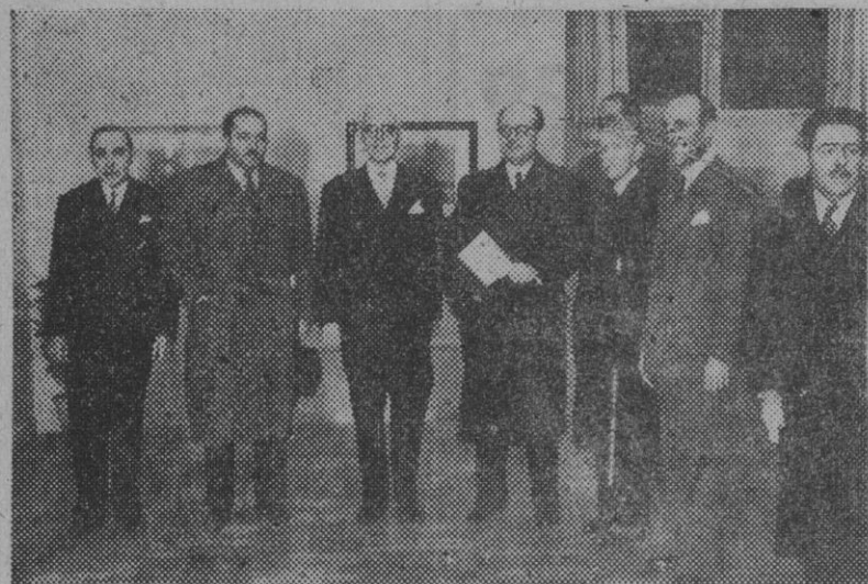
El ministro de Educación Nacional, señor Ibañez Martín, y otras personalidades que asistieron a la inauguración de la Exposición de Acuarelistas Catalanes en la Sociedad de Amigos del Arte de la capital de la nación.