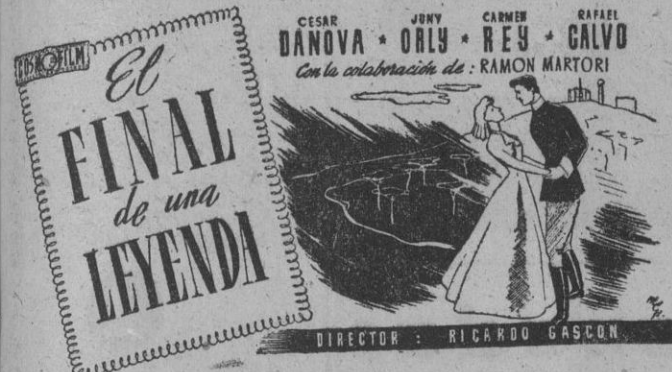
El Final de una Leyenda. Director: Ricardo Gascon.

También a usted le conmoverá esta historia de amor!