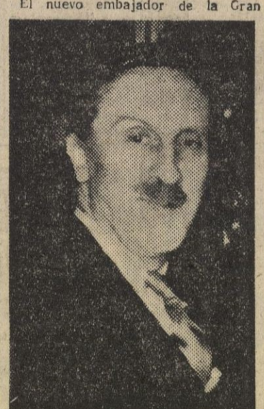
Sir John Balfour, que acaba de ser nombrado embajador de Inglaterra en la capital de España

EL PRESUPUESTO FRANCÉS DE REARME, DEFINITIVAMENTE APROBADO