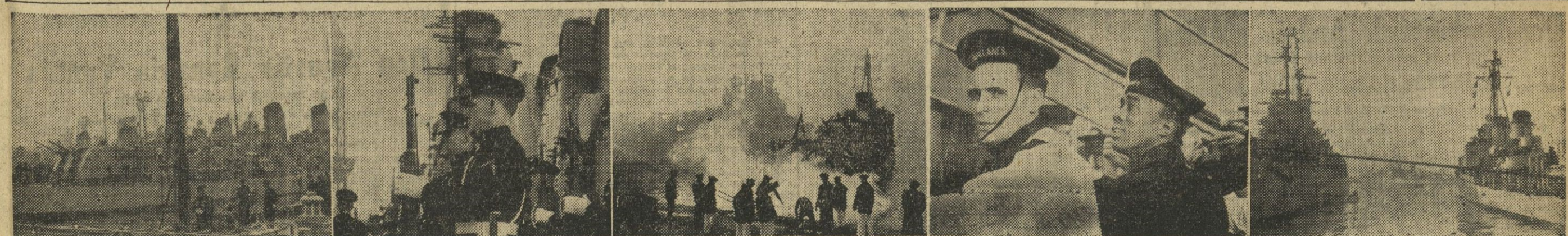
He aquí varios aspectos de la llegada a nuestro Puerto de la VI Flota de la Marina de Guerra de los Estados Unidos, en el Mediterráneo.

Vertical text on the left margin, including words like 'Mien-Nacio', 'AS de RA', 'bom-vonju', 'por las hicle', 'y por os du', 'e.) — el Con- en fa- trono', 'na, de nio, según', 'en se y el', 'puesta ambza', 'an Go minis- opular, régi-', 'a. —', 'ral De que las', 'ho, de aliada', 'o bata- anoi y', 'ncción', 'sar de ad nu- perderá', 'to des- iembre', 'se re- eu, si- an me- les. —', 'nos', 'ANOS', 'A', '55', '943', '7 8', 'ulaba. 2', 'a. 3. Dios', 'al repeti-', 'Acome- Molusco', 'és: Nega- una le- Al reve- inaban-', 'fructivo', 'Al revé- mbolo de', 'Nota. 4', 'n catalán', '6. Vocal', 'Nombre', 'olecimen-', 'lo.', '942', 'ta. 2. No', 'rán. 5.', 'noyl. -', '10. Are-', 'Aras. 2', 'Rol - eB', 'lairE. 6', 'ON - odl', 'Aida.