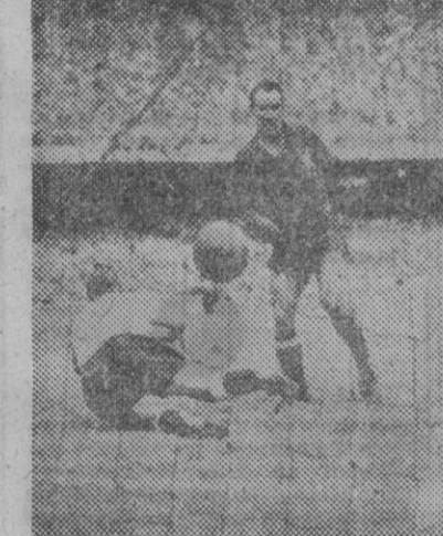
Es el partido contra Inglaterra en el Campeonato del Mundo...

Treinta y tres mil ciento cuarenta y seis jugadores federados