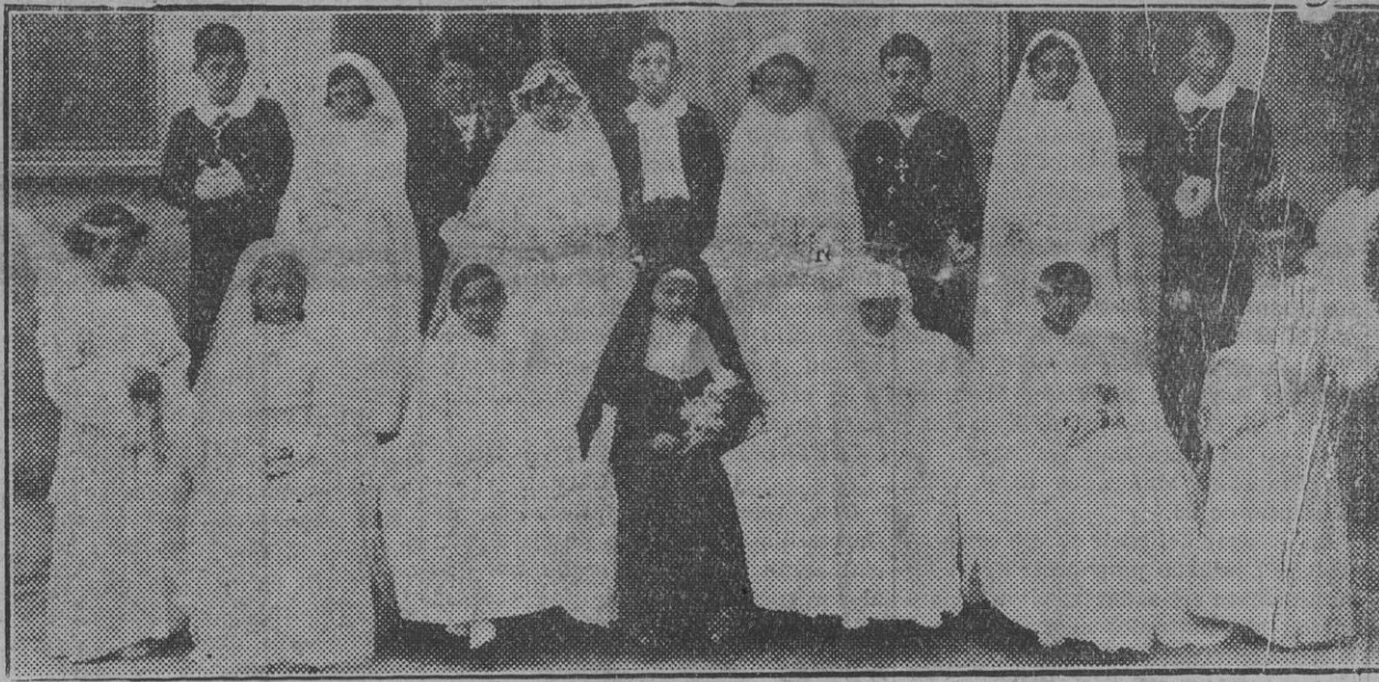
Grupo de niños y niñas de las Escuelas Vascas que ayer hicieron su primera Comunión

Celebróse anteayer, con rebosante solemnidad el emocionante acto de hacer la primera comunión 9 niñas y 5 niños, pertenecientes a las Escuelas Vascas en la Capilla de los PP. Escolapios.