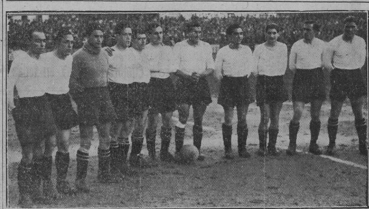
RACING DE SANTANDER-OSASUNA.-El "once" montañés, el equipo de las sorpresas, que el domingo nos deparó la grata de su derrota por un Osasuna libre de su "neurastenia" de estos tiempos por obra y gracia de un reservista. ¡Bravo, Irastorza!