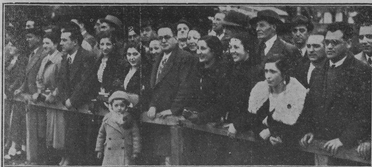
EL DOMINGO EN SAN JUAN.-Público heterogéneo, menos en osasunista mo, que es factor común, presenciando con satisfacción el encuentro en que los rojos tuvieron tal color en el rostro...

Con este triunfo nuestro equipo se rehabilita y conquista la confianza de sus incondicionales.-El Racing es un señor equipo. El debut de Irastorza en el primero de Osasuna resulta un éxito para el joven jugador.-¡Al fin! vemos un buen arbitraje.