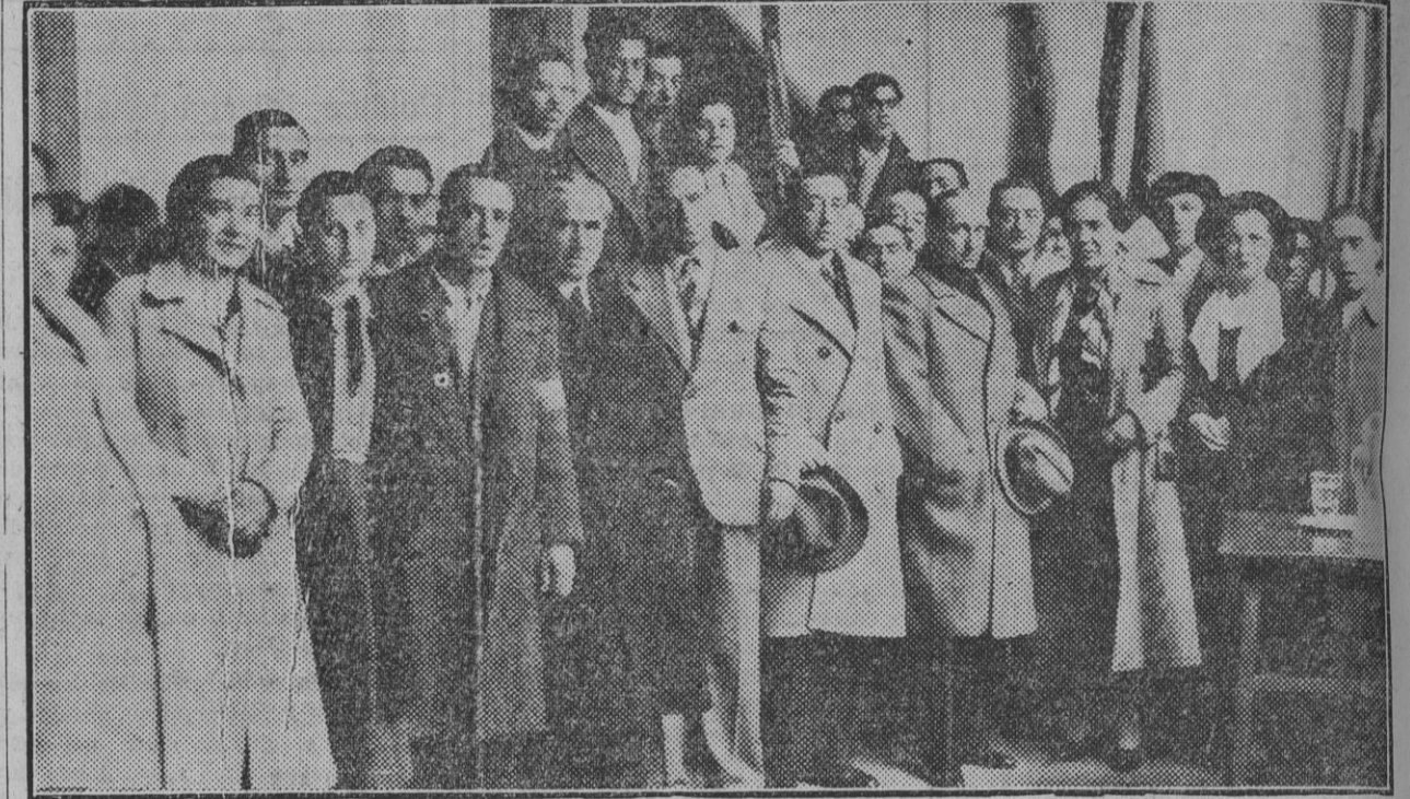
Los oradores del mitin del domingo en el Euskal Jai; el ex ministro de la Gobernación don Santiago Casares Quiroga, la ex directora de Prisiones señora Victoria Kent y el ex diputado por Navarra don Mariano Anso, acompañados por un grupo de correligionarios

En la mañana del domingo se celebró en el "Euskal Jai" el anunciado mitin organizado por Izquierda Republicana.