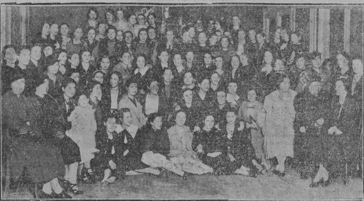
Profesoras y alumnos de la Escuela del Hogar en el acto de apertura de curso celebrado el pasado domingo.

A todos -sus familiares- enviamos nuestro sentido pésame.