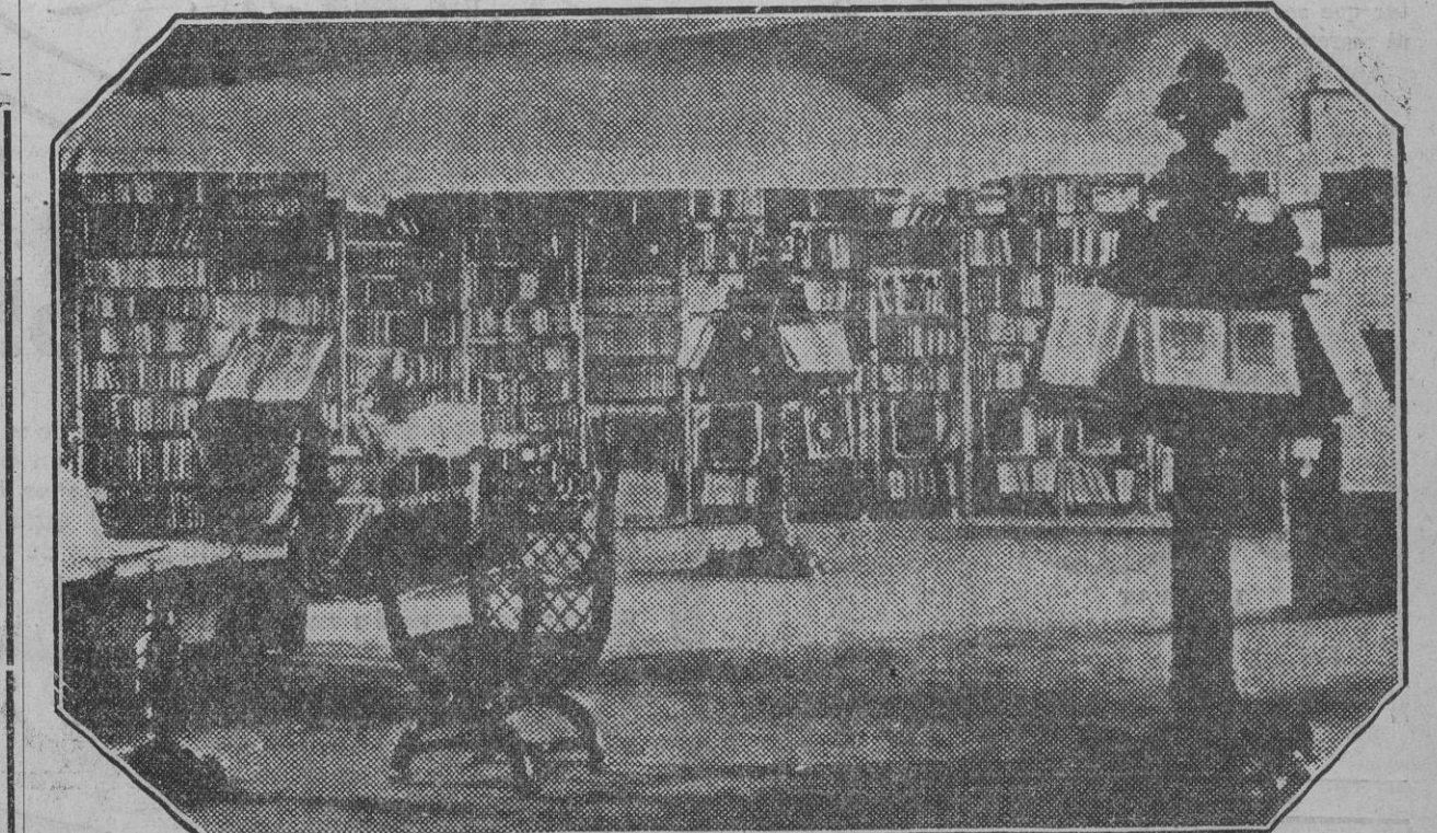
OVIEDO.—Aspecto parcial de la Biblioteca de la Universidad de Oviedo, destruida durante los sucesos de Octubre y que va reconstituyéndose con donativos de centros culturales y de particulares, que acaba de instalarse con carácter provisional en el Monte de Piedad de la capital asturiana.