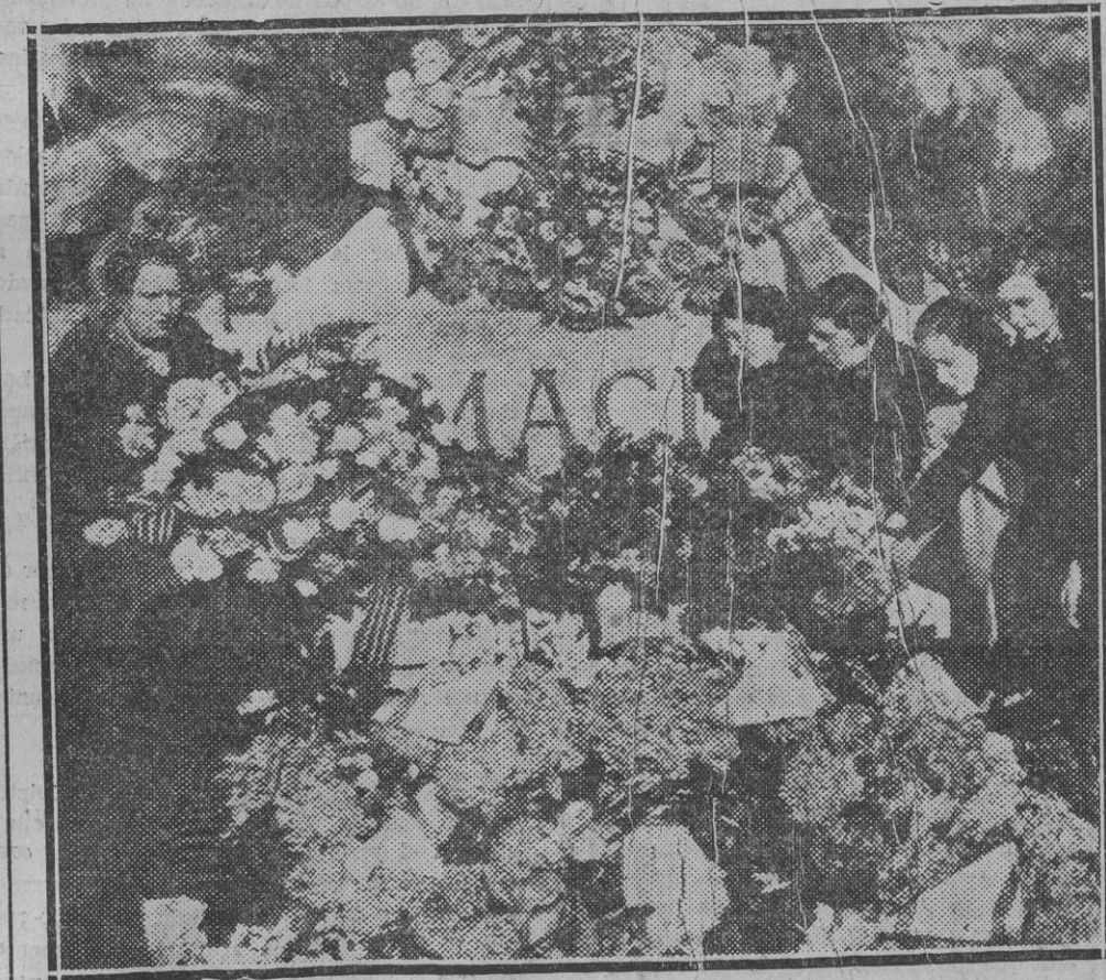
Con motivo del primer aniversario del fallecimiento de Meziá, numerosísimos catalanes han desfilado ante su tumba, cubriéndola materialmente de flores, como homenaje a su memoria.

Se convoca a todos los componentes de las cuerdas de hombres de estos Coros para esta noche a las ocho y media en punto en el local de ensayos.