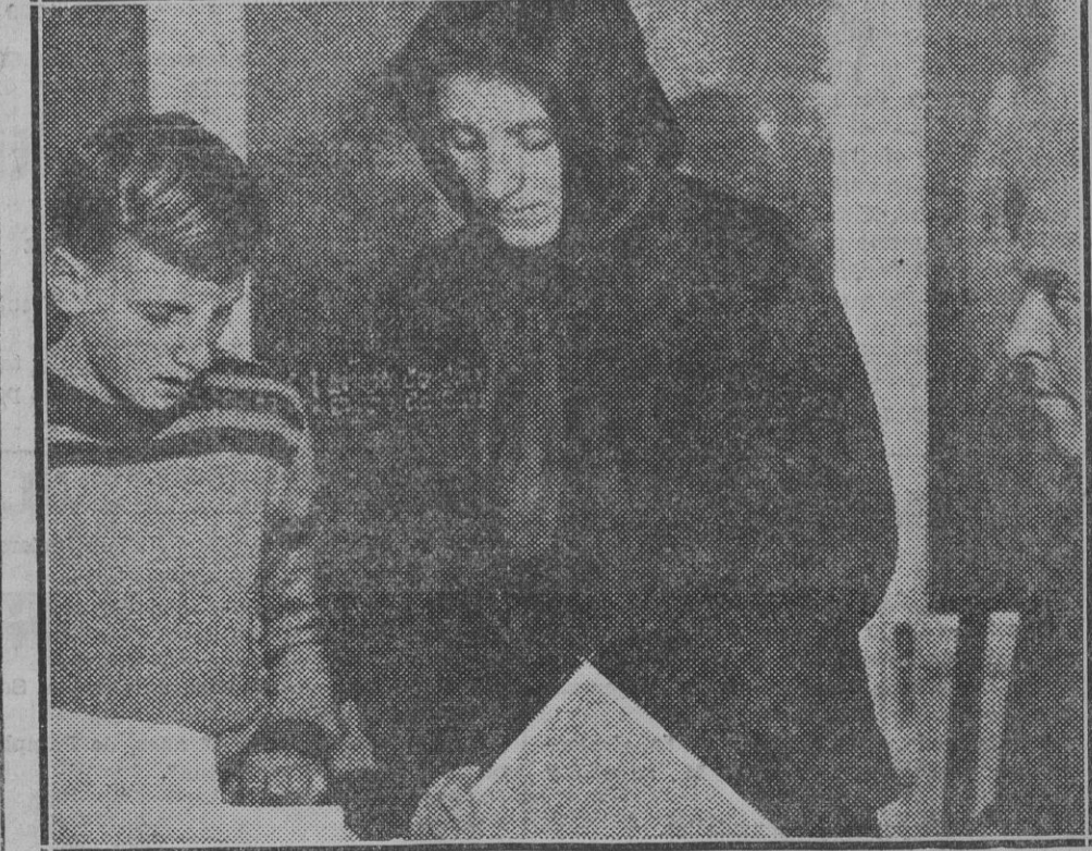
Se dió fin a la revolución. Pero quedan sangrantes y dolorosas sus consecuencias. He aquí a una pobre viuda, que se ve en la triste necesidad de pedir una beca en un colegio para su hijo a quien no puede mantener. Horrible situación de una madre que ha perdido su marido, y que va a dejar su hijo en otras manos. ¡Que remordimientos de conciencia tienen que producir estos casos de dolor!

Al recibirnos ayer el alcalde don Tomás Mata a los informadores locales nos dió cuenta de que, con motivo de celebrar mañana domingo una función religiosa en la iglesia de Santo Domingo para honrar a su patrona Santa Cecilia, los músicos de Pamplona, el concierto que debía celebrarse al medio día en la Plaza de la República quedaba suspendido, y que la banda "La Pamplonesa" obsequiará al vecindario a la ida y al regreso de la función con unas bonitas composiciones.