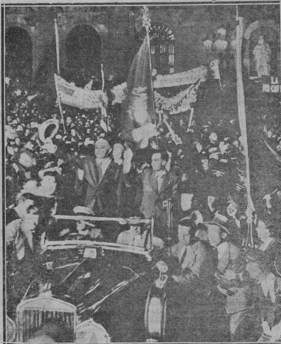
Momento de llegada a Barcelona de los diputados catalanes que se han retirado del Parlamento del Estado para protestar de la política de ataques a la autonomía de Cataluña

Por dificultades de organización, la Junta provincial de la Sección Navarra del Colegio de Odontólogos de la séptima Región ha acordado diferir para fecha próxima la celebración de la asamblea de Junta general extraordinaria para la que se había convocado. En su virtud, ya no tendrá lugar mañana domingo a las diez y media de la mañana. Lo que se hace público para conocimiento de los señores Colegidos.