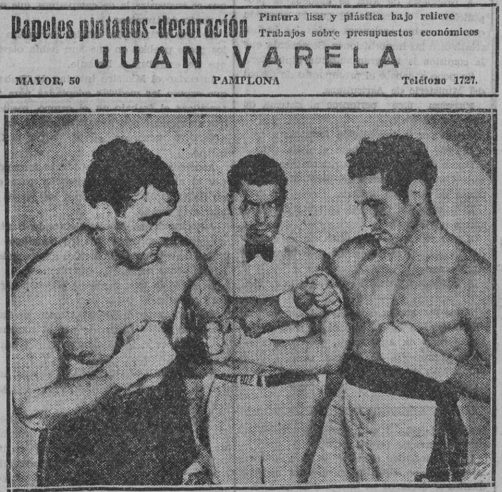
Primo Carnera y Max Baer con Demsey como árbitro en un film cinematográfico. En el encuentro sobre el ring "verdad" ya es conocido el resultado adverso del combate para el gigante de las tierras mussolinianas

Papeles pintados-decoración Pintura lisa y plástica bajo relieve Trabajos sobre presupuestos económicos JUAN VARELA MAYOR, 50 PAMPLONA Teléfono 1727.