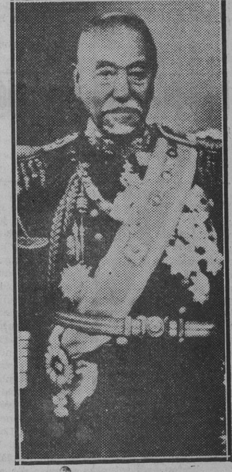
El almirante japonés Togo, que tan alta nombrada alcanzó durante su afortunada intervención en la guerra de su país contra Rusia, culminada en la batería de Tsushima, que ha fallecido recientemente a los 37 años