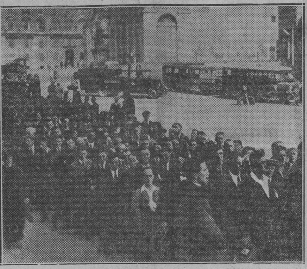
Obreros ingleses dirigiéndose al Vaticano en peregrinación de amor y adhesión al Pontífice Romano

Y puesto que el objetivo de nuestra actividad ha de ser la defensa, lo más eficaz que sea posible, de nuestros intereses espirituales, en primer término, y de los económicos después, vamos a examinar cuáles sean éstos para así acomodar nuestros actos a los fines que perseguimos.