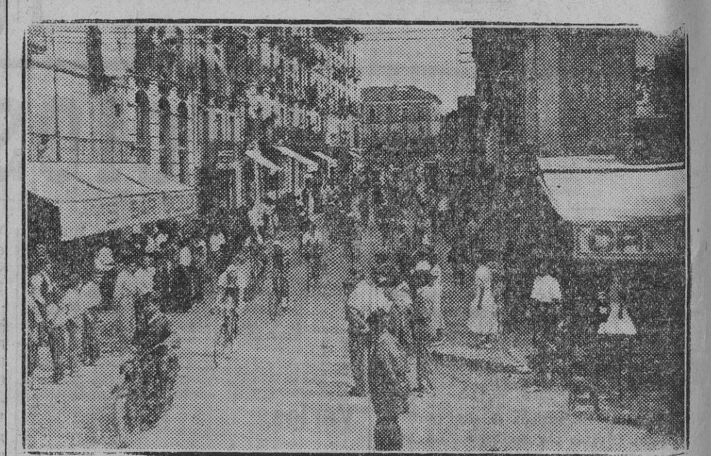
Salida de los chirindularis que participaron en la interesante prueba ciclista de ayer