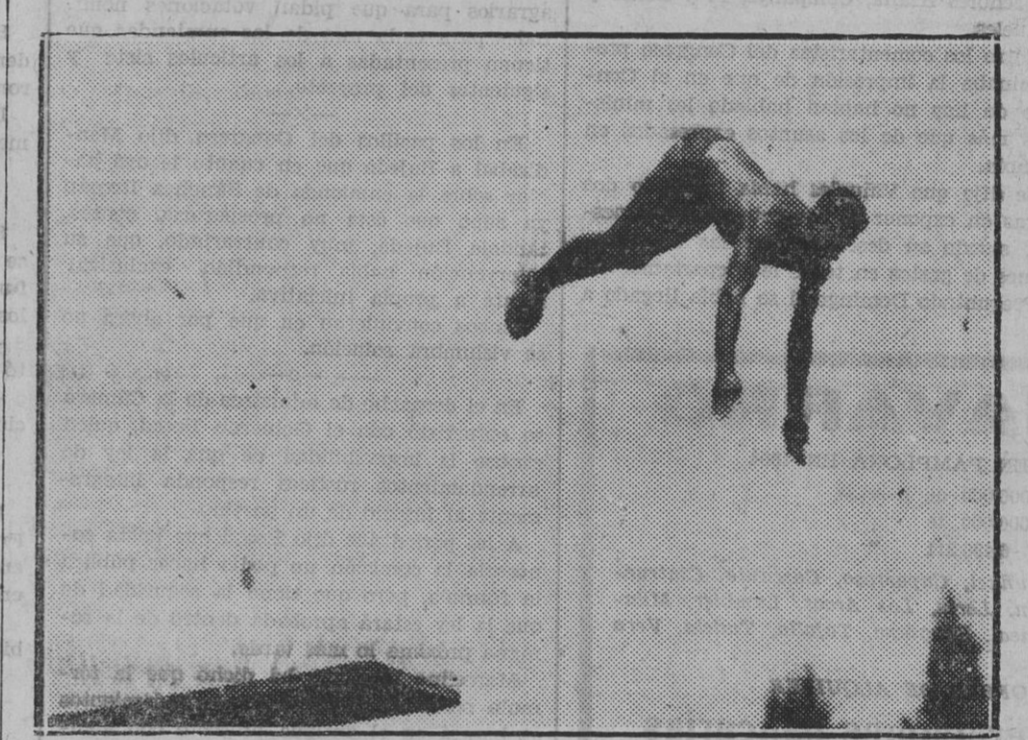
Andrés iniciando el salto de la carpa en la competición de saltos