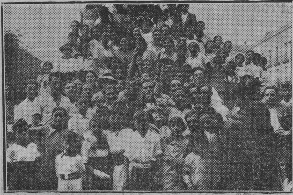
A ninguno de estos causan sensación las conferencias económicas y del desarme