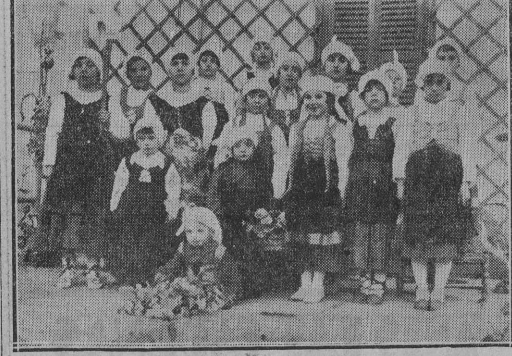
Un encantador grupo del Cuadro de popoliñas de Ituren que tomó parte en "Gora Goritxu".