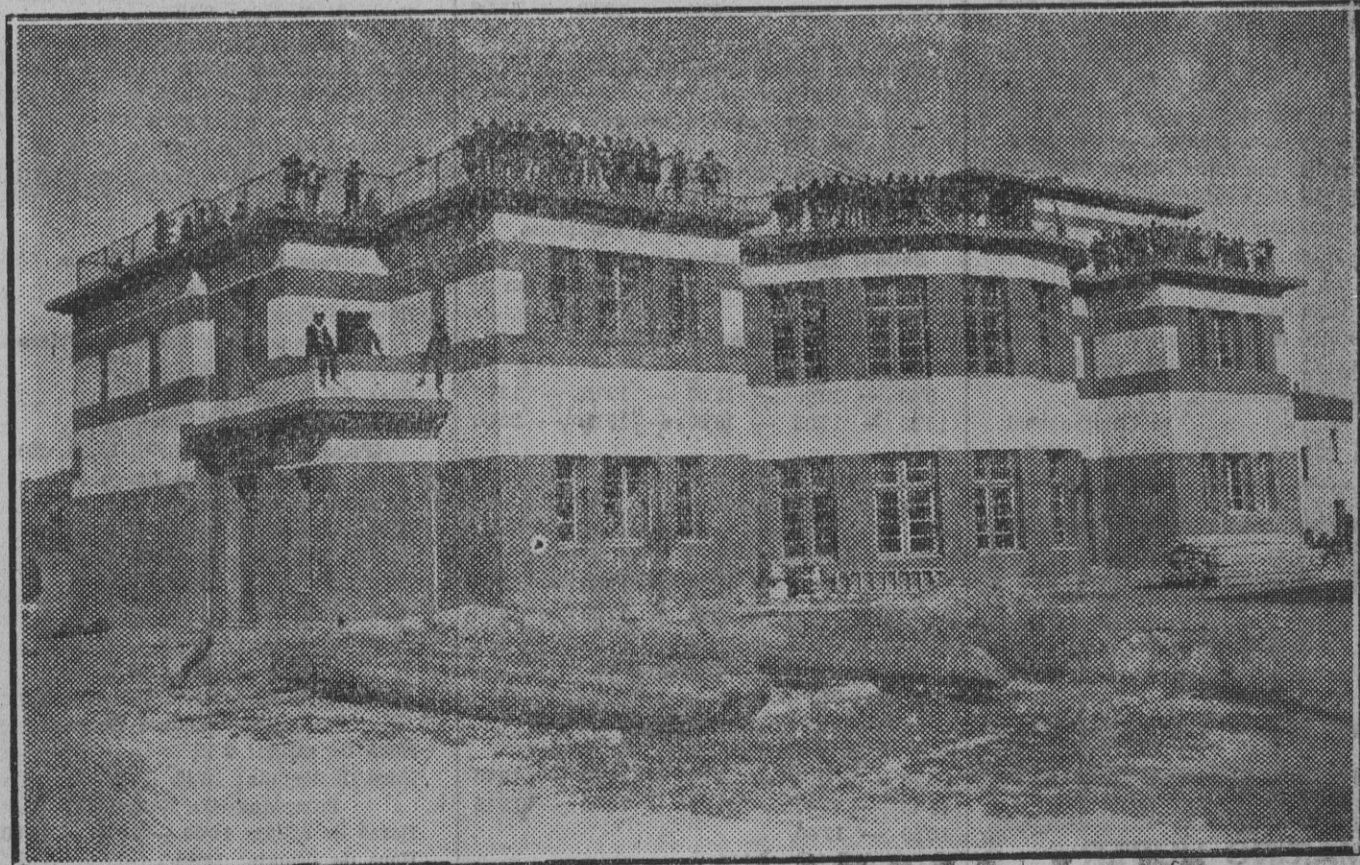
El hermoso edificio construido por el Ayuntamiento de Milagro para instalar en él las escuelas de la importante villa ribereña, y que será inaugurado hoy oficialmente con fiestas extraordinarias