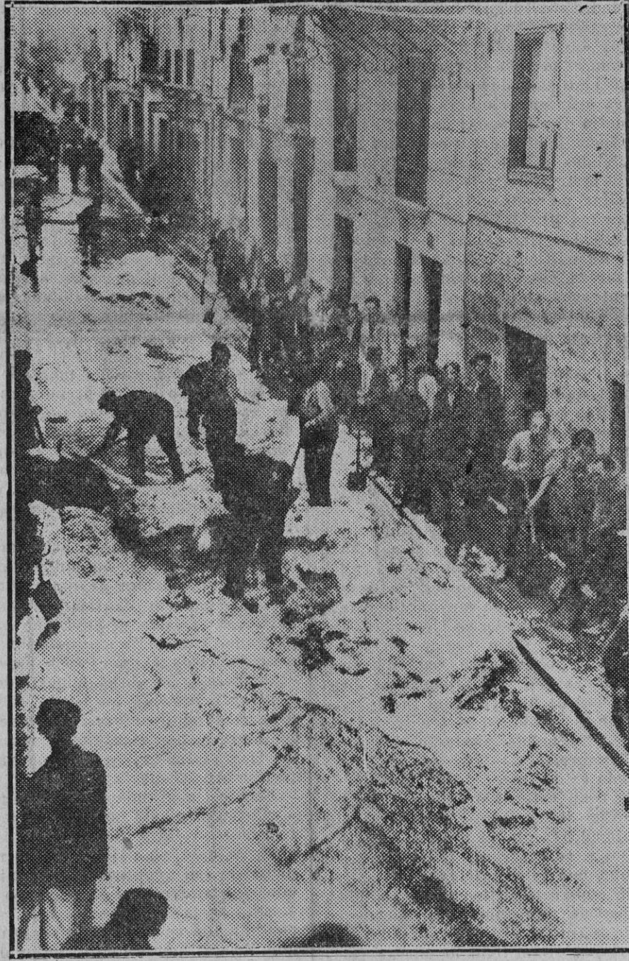
Aspecto de la 'calle Calderería' después de la tempestad de granizo.

Con este motivo se preparan diversos actos de carácter nacionalista de los cuales tendremos al corriente a nuestros lectores.