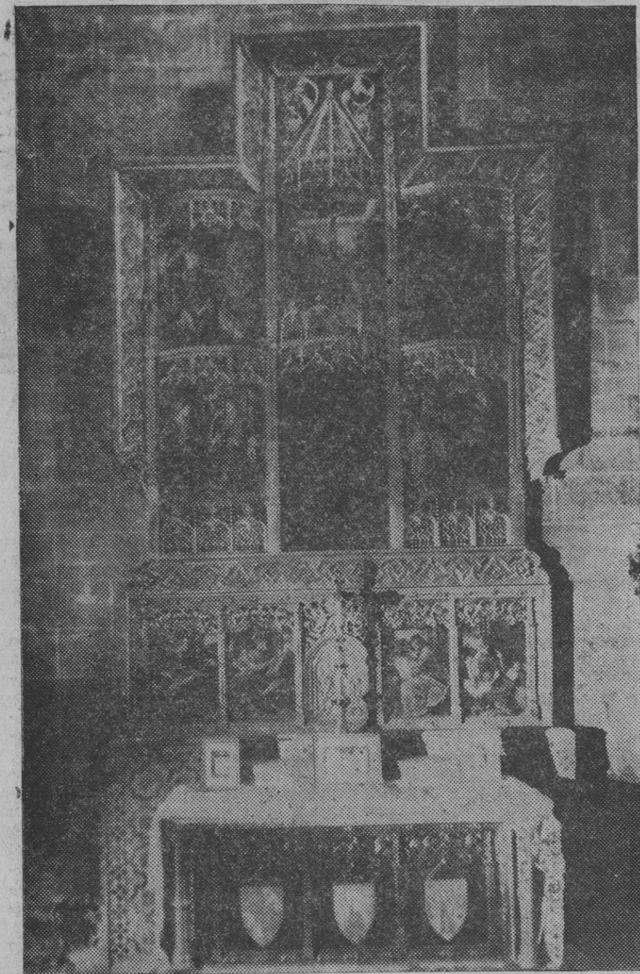
Bello retablo ojival que ha sido colocado en la Capilla de San Juan Evangelista, de la Catedral, la cual ha sido restaurada el año pasado