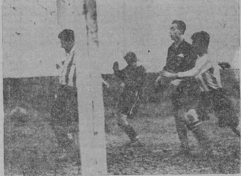
AURORA, 7.—ERRI BERRI 2 Momento de marcar el quinto goal.

Larrinoa, Baragaño, García; Santi, Lordo, Oscar, Larrinaga, Cisco.