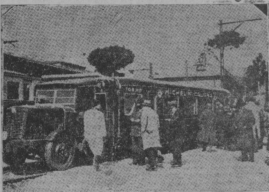
Tren automóvil italiano que circula desde hace unos días entre Roma y Ostia y cuyos ensayos han constituido un éxito definitivo tanto que ha quedado establecido el servicio.