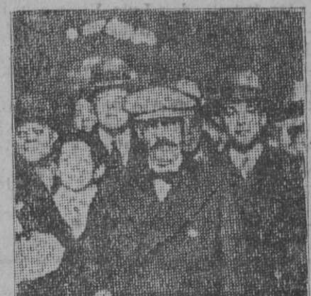
Llegada del ex Presidente argentino a la estación del Norte, en París.

Las mujeres débiles, las embarazadas y las que están criando, se fortifican rápidamente con el VINO OÑA, del doctor Aristegui.