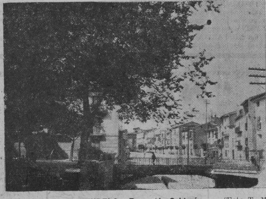
TUDELA.—Paseo de Calderón