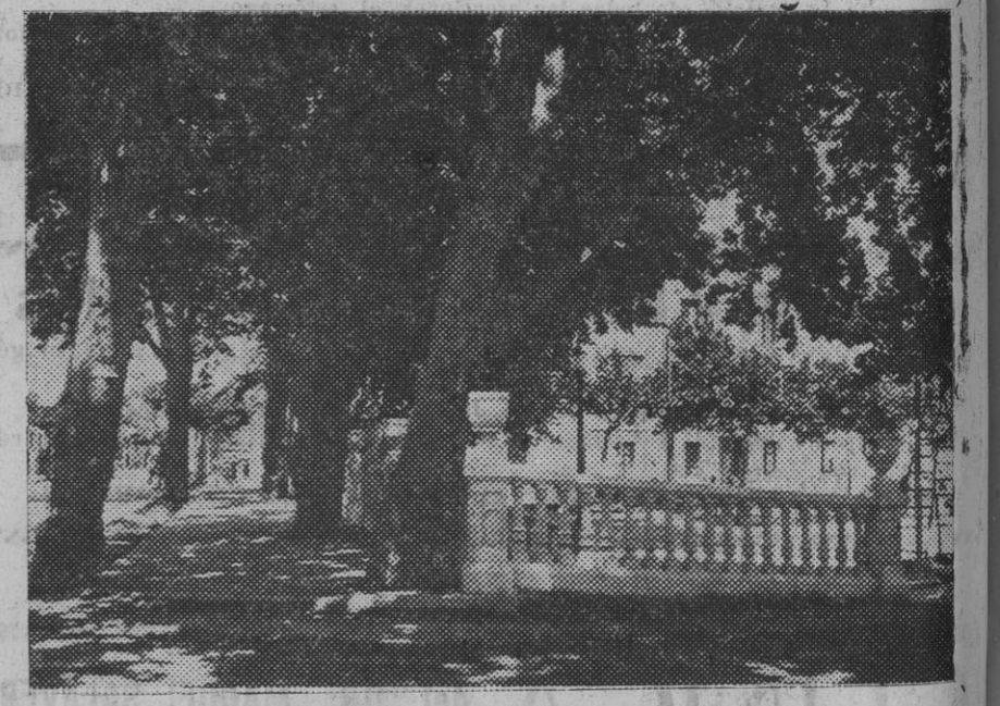
TUDELA.—Paseo del Marqués de Vadillo, centro de atracciones de las fiestas, y lugar destinado a la gran verbeno que tendrá lugar ja las diez de esta noche, inaugurándose, con tal motivo, la extraordinaria iluminación instalada por la casa Rivas, de Barcelona.