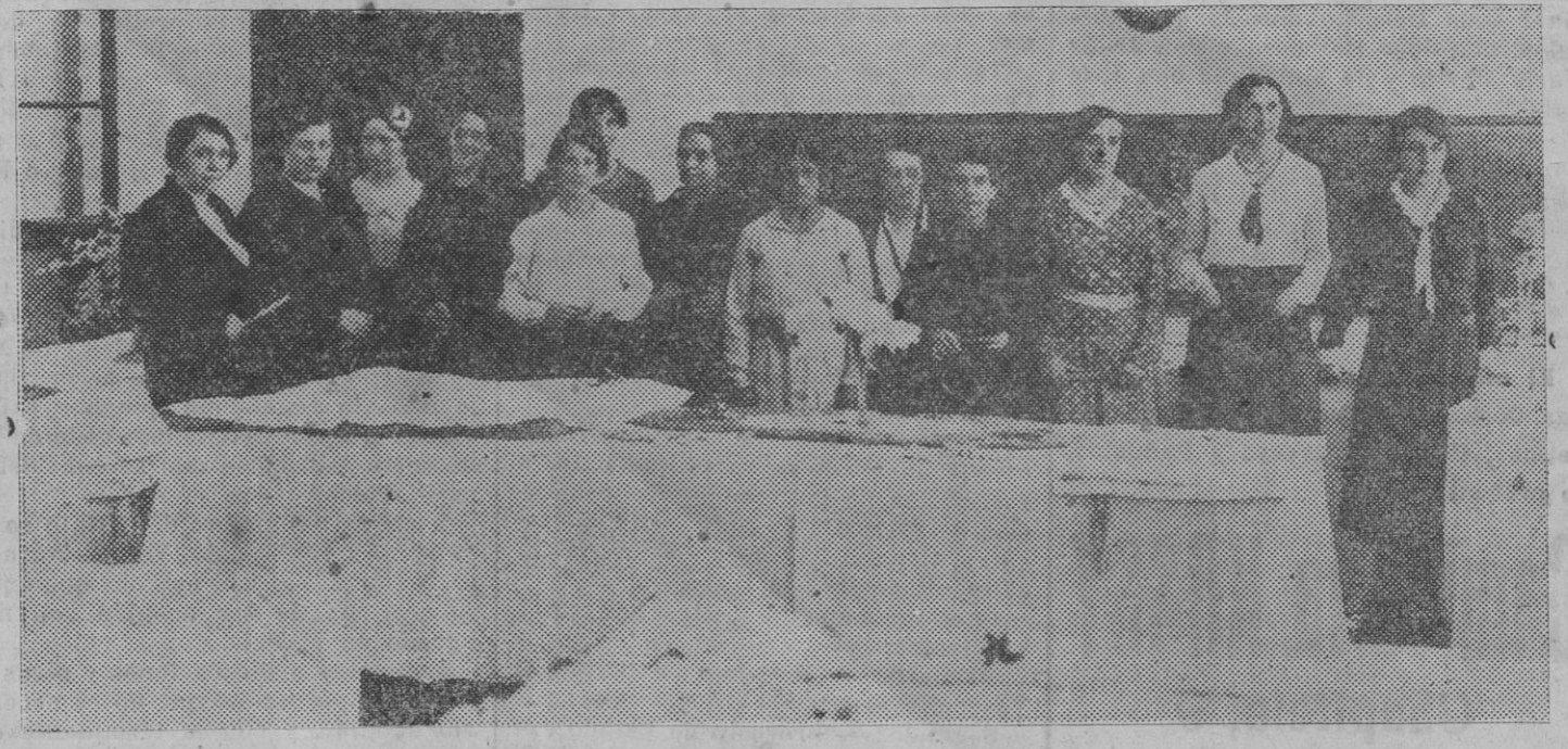
Grupo de Profesoras de las Escuelas de San Francisco, en uno de los locales de la exposición de labores. (Foto Zaragüeta).