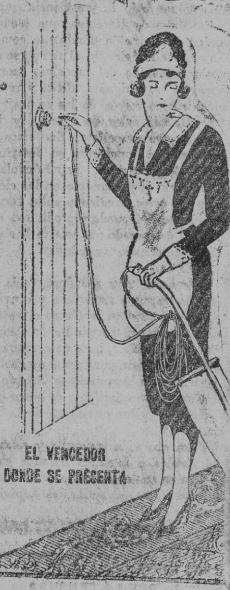
EL VENCEDOR DONDE SE PRESENTA