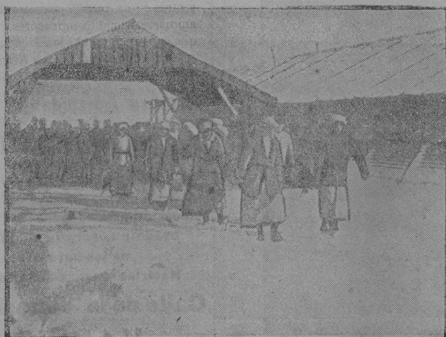
DE LA GUERRA.—Transporte de heridos.

Cuanto se relaciona con la colaboración política, militar y literaria de EJERCITO Y ARMADA, es de la exclusiva competencia del director.