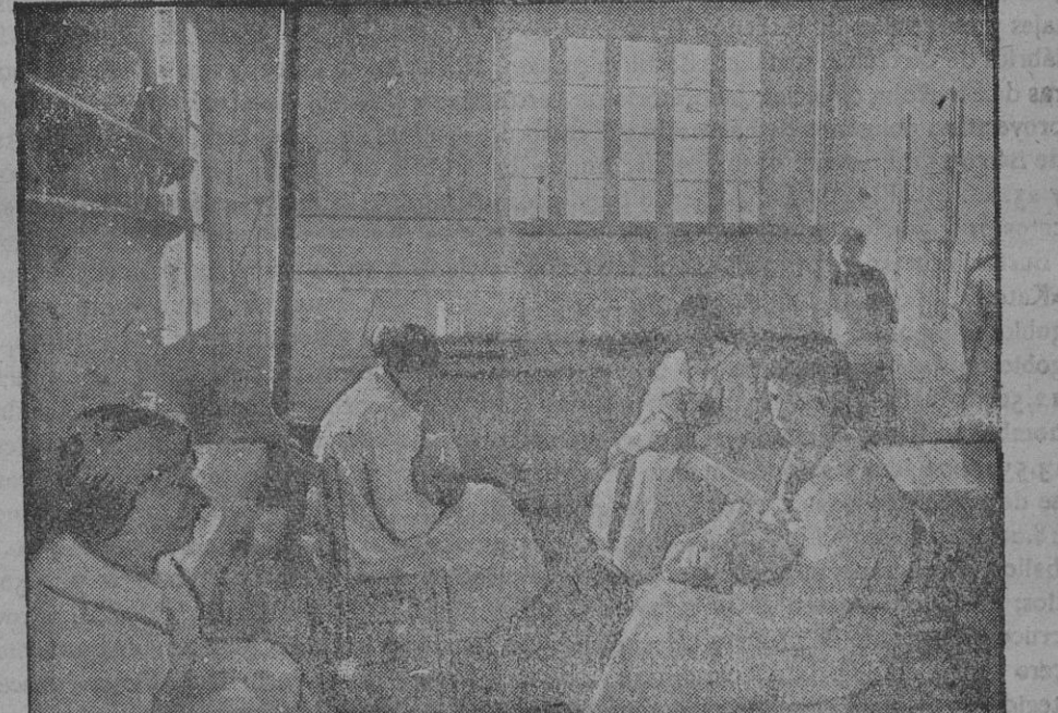
DE LA GUERRA.—Sala de lactancia para huérfanos de los muertos en campaña

La población está en un estado de extrema tensión nerviosa.