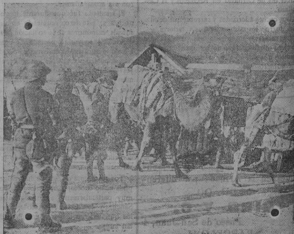
DE LA GUERRA.—Fuerzas inglesas en Egipto.