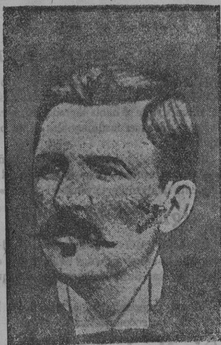
Mr. Wenceslao Bras, presidente de la República del Brasil.