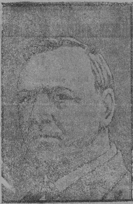
Mr. Lansing, ministro de los Estados Unidos.

En vista del tremendo fracaso artístico y financiero del teatro catalán en Barcelona, el señor Oliver le requirió y el eminente trágico ha aceptado las proposiciones.