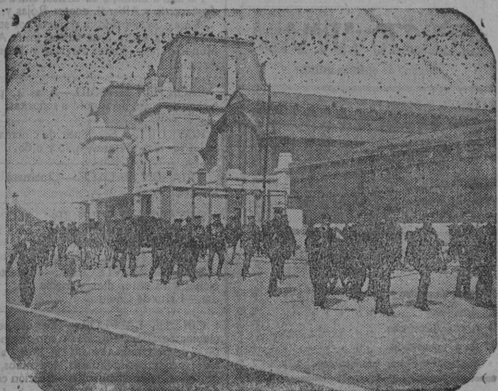
DE LA GUERRA.—Fuerzas expedicionarias en Calais.

Cuanto se relaciona con la colaboración política, militar y literaria de EJERCITO Y ARMADA, es de la exclusiva competencia del director.