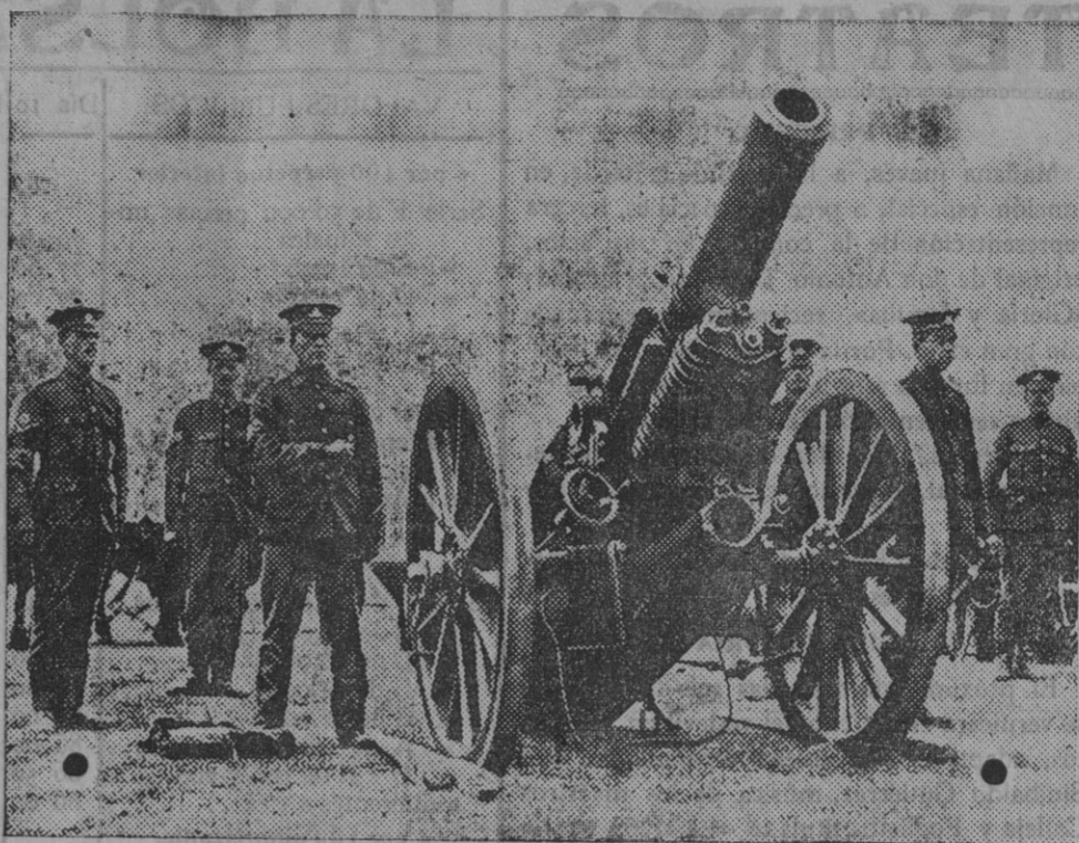
DE LA GUERRA.—Cañón antiaéreo.