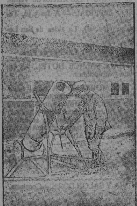
Lanzabombas de madera tomados a los alemanes.

La Cruz Roja ha enviado un tren especial con material sanitario.