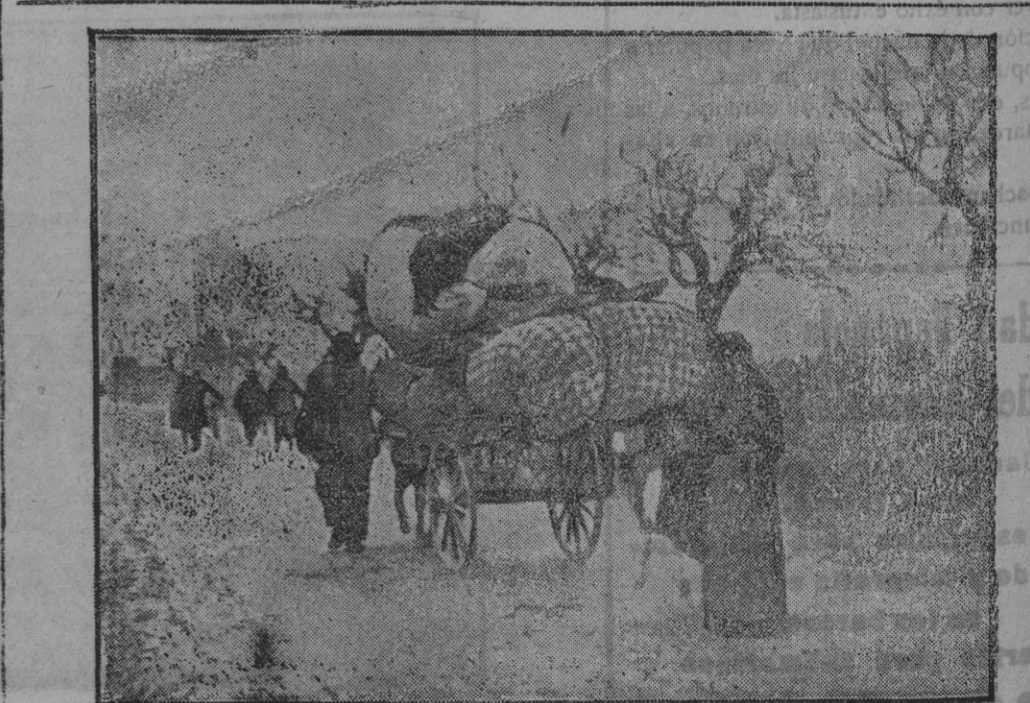
Alecanos italianos huyendo de los horrores de la guerra.

PARIS 1.—Alfred Chales de Rostchild, de la conocida firma Rostchild Hijos, banqueros, ha muerto anoche a la edad de setenta y cinco años. Se dice que su salud había sido muy afectada por el exceso de labor, debido a la relación de la firma en las operaciones financieras con los aliados.