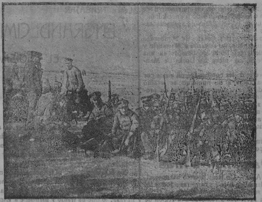
Oficiales franceses enseñando el manejo del fusil lanza bombas a un oficial griego.

El Gobierno tiene en estudio otra serie de medidas concernientes a los indígenas argelinos.