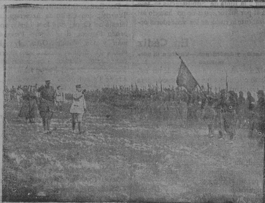
El general Petain saludando la bandera de un regimiento belga.