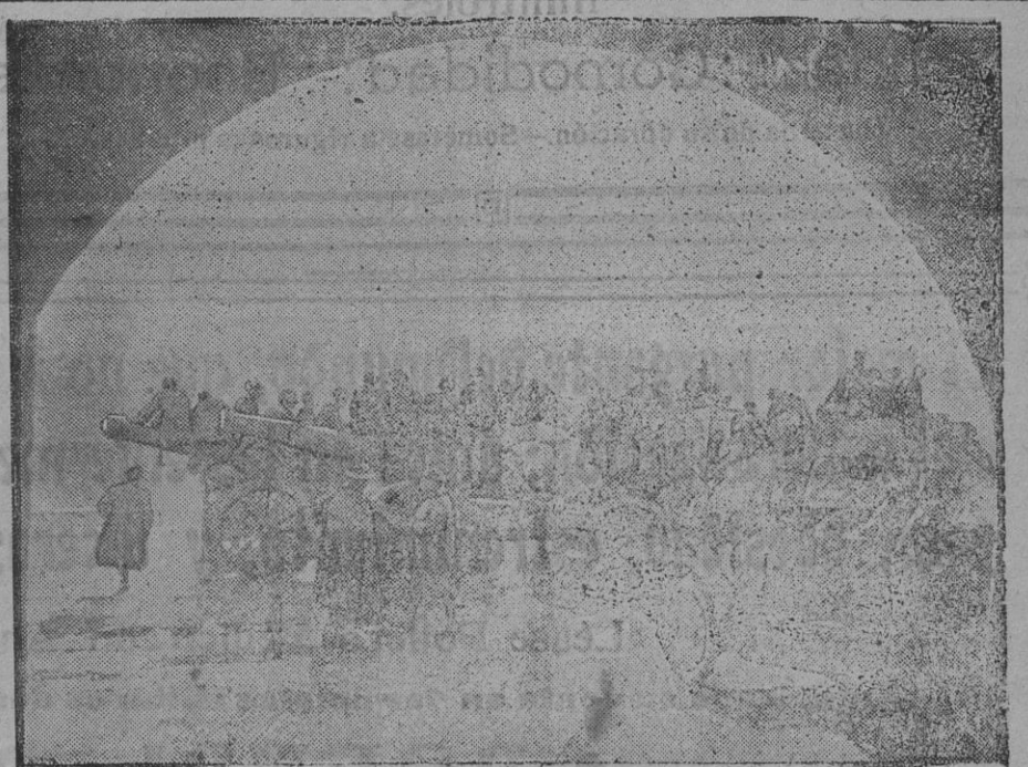
Artillería francesa pesada en Castellfranco (Italia).

Se deberá oír al Estado Mayor Central antes de disponer reducciones extraordinarias de fuerza en filas y cambios permanentes de Cuervos de una y otra guarnición.