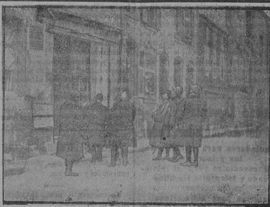
La misión catalana visitando Pont a Nou: son,

Su muerte ha sido muy sentida, pues contaba con grandes simpatías. Aquí estuvo mandando el regimiento de Borbón, y con anterioridad había pertenecido a la guarnición.—C.