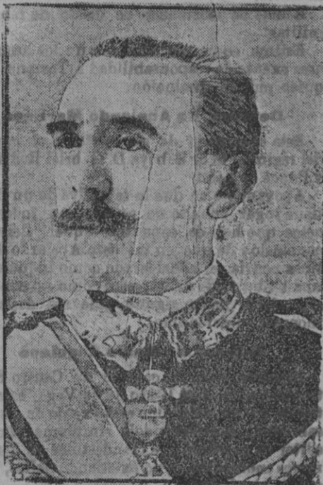
El general italiano Pozzo.

La culpa reside en nuestras diferencias personales; en que se obstruyen proyectos para que tal partido o tal hombre no alcance la fuerza que otorgaría el realizar obra positiva. Y esos móviles bastardos, esas menudas pasiones no se destruyen, no se ahuyentan si quiera con una nueva Constitución.»