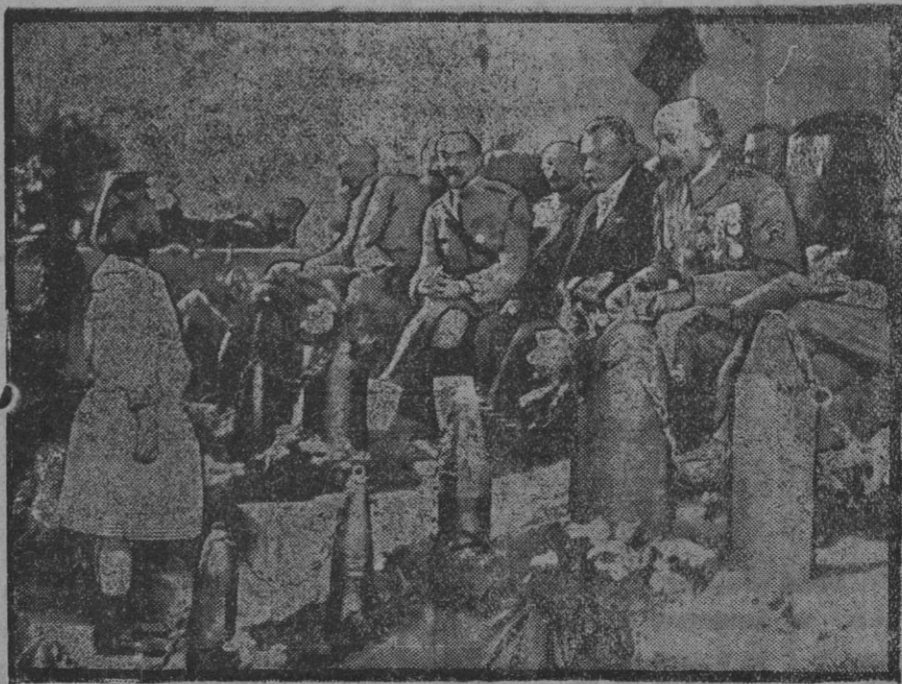
Distribución de premios en Alsacia.

Un ataque enemigo emprendido contra Pola y Parenzo, fracasó por completo.