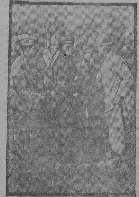
El primer registro de los prisioneros.

Como le ha dicho á usted al principio, se trata de una revista extranjera.