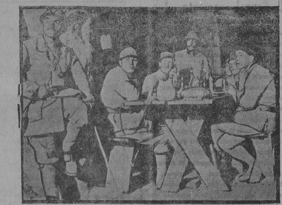
Interior de la famosa caverna del Dragón, ocupada por los franceses.

No nos faltará el trigo, porque las cantidades en almacén y las últimas cosechas copiosas bastan a satisfacer nuestras necesidades interiores; no nos faltará el aceite, porque en previsión de su escasez y del progreso en el alza de sus precios, se ha prohibido totalmente su exportación; no nos faltará el combustible, ni, por lo tanto, el alumbrado y la calefacción, a los que sirve de primera materia.»