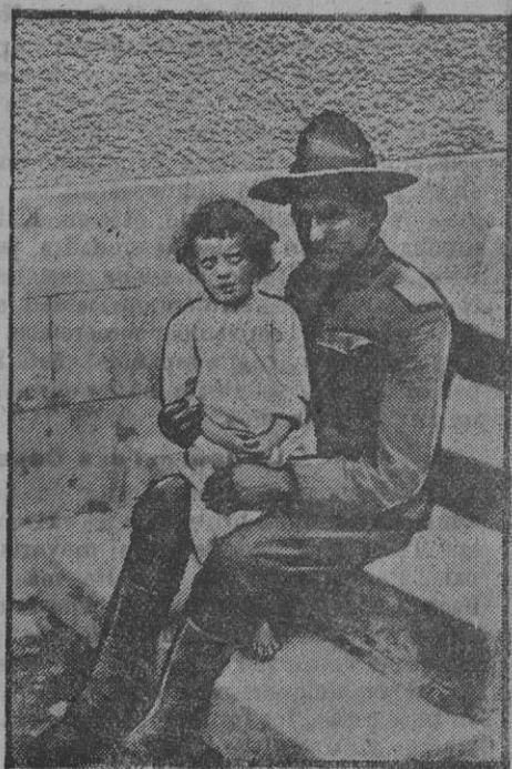
Soldado americano con un niño francés

3.º Los cesantes comprendidos en la relación de bajas provisionales publicada en la «Gaceta» á que se refiere la disposición anterior que no soliciten de V. I. ser dados de alta, por medio de instancia en que hagan constar cuantos datos comprende el modelo adjunto, antes del 31 de Diciembre próximo, serán baja definitiva en el escalafón al cerrarse el de 1918 en la mencionada fecha.