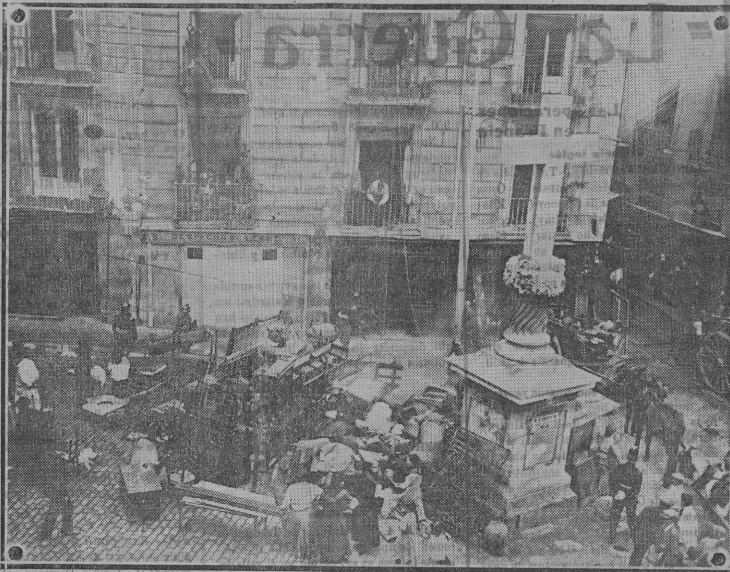
Los vecinos de las casas que amenazan ruina en Puerta Cerrada, en el momento de desalojarlas.

Dado en Palacio á 3 de Mayo de 1917.—Alfonso.—El ministro de la Gobernación, Julio Burell.