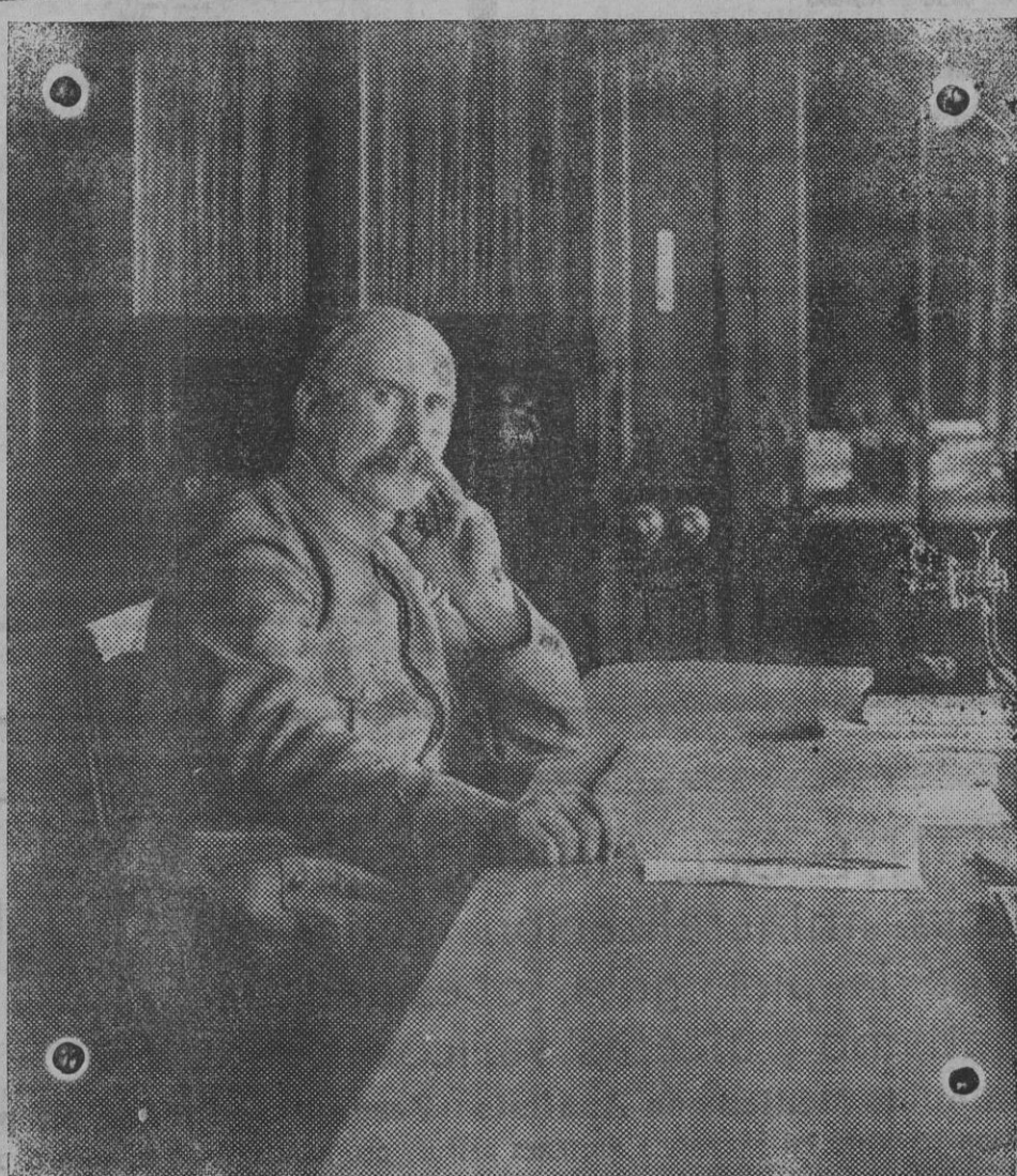
El general Petain, heroico defensor de Verdun, que ha sido nombrado jefe del Estado Mayor Central del Ejército francés.

LAS PALMAS, 5.—Por haber quedado incumplidas la ofertas del ministro de Fomento de enviar dinero á esta jefatura de Obras públicas para las carreteras, se han paralizado las obras, siendo despedidos los obreros.