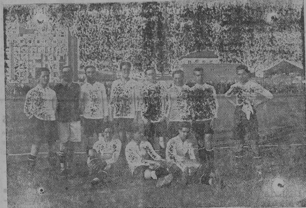
Equipo del Athletic Club, de Madrid, que ha jugado con el Athletic, de Bilbao, un partido de balompié.

Museo de Reproducción Artística (Alfonso XII, núm. 52), de nueve á doce y de quince á diecisiete.