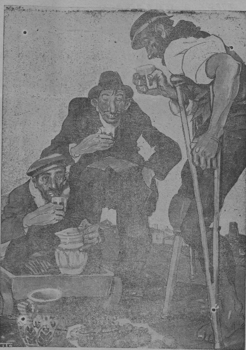
«A su imagen y semejanza».—Una de las más notables caricaturas de la Exposición de Tito.

Es el cliché eterno. ¿Qué entenderá «Le Temps» por situación desesperada?