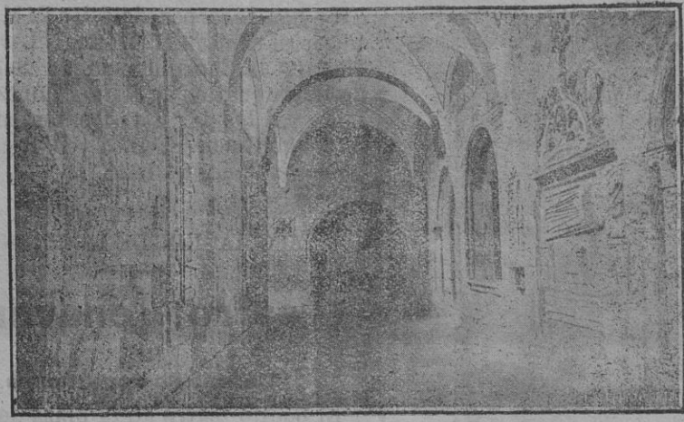
Claustro de la Catedral vieja de Salamanca.