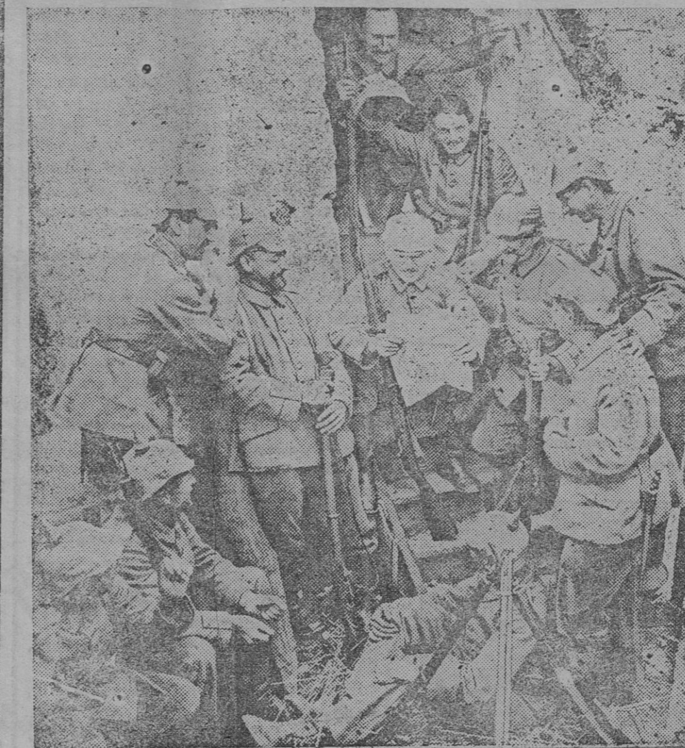
ESCENAS DE LA GUERRA.—Leyendo un periódico durante un descanso.

Quejábanse los primeros de la desconsiderada incorrección que con ellos se había tenido, y argüían: Las reformas militares se han llevado con tal secreto que nadie pudo vislumbrar su conteni-