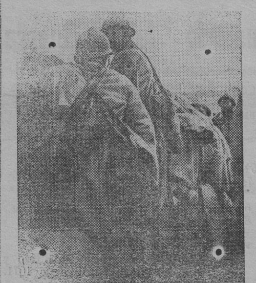
Grupo de tropas coloniales en las gradas de una trinchera avanzada en Artés.