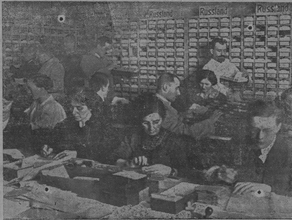
Oficinas de información de las tropas alemanas que se encuentran prisioneras, instaladas en Berlín.

Seamos amigos y buenos vecinos; pero no a tanta costa.