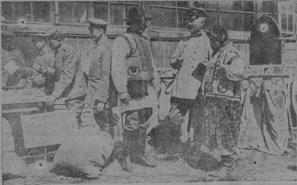
El patio de la ambulancia de correos en la reconquistada Galitzia.

tes de uno ó de otro bando hicieran lo posible por arrastrarnos á la guerra; pero que los aliados tengan aliados para ello entre los españoles, eso más que extraño es inconcebible.