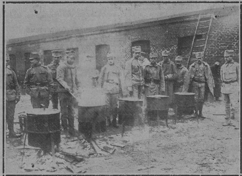
Los gendarmes polacos haciéndose la comida de campaña.

La opinión pública, guiada por los hombres que asumen la responsabilidad de la dirección de las fuerzas políticas, es en definitiva la que ha de determinar el camino más conveniente para España. Yo creo que lo mismo aquellos que defienden una solución que