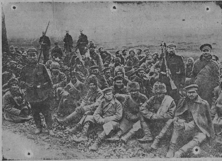
Tipos de prisioneros rusos detenidos cerca de Lodz.