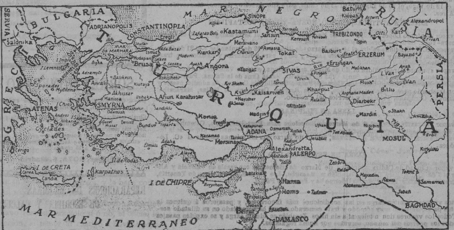
La escena de los últimos combates navales entre los turcos y los aliados.