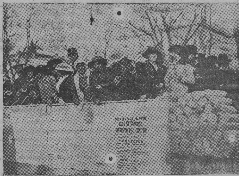
Detalle de la tribuna de la Casa de Socorro del Centro.

La interpretación, aceptable y discreta.