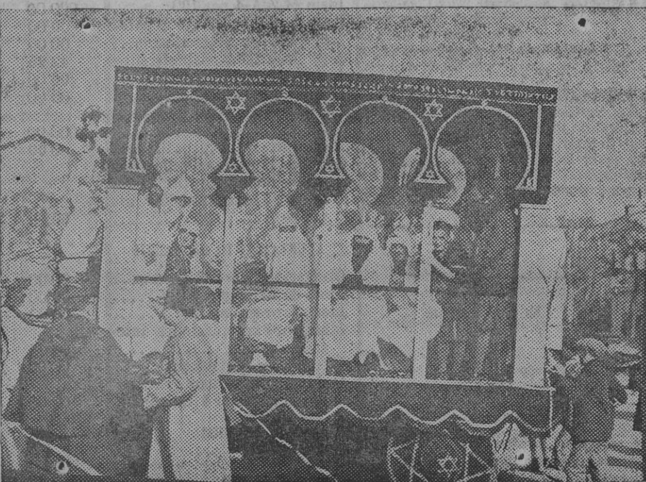
La carroza «Salón moro», que ha obtenido el tercer premio.

Como la luna está fuera de su trayectoria, puede contemplarse con un telescopio cuando el cielo está claro.