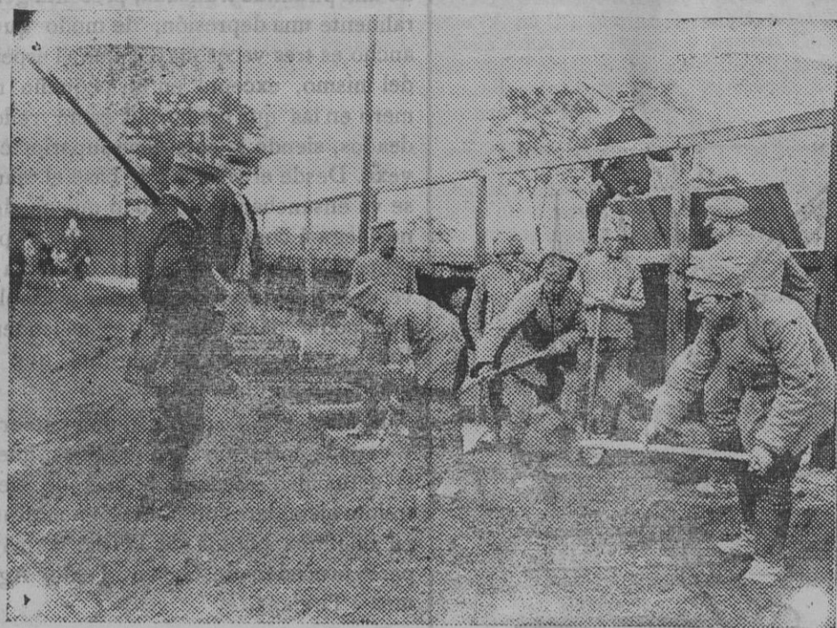
Prisioneros rusos en Brandemburgo trabajando en la vía férrea.

«Desde el mar hasta el Lys la acción ha presentado ayer un carácter de menor violencia que en los días anteriores.