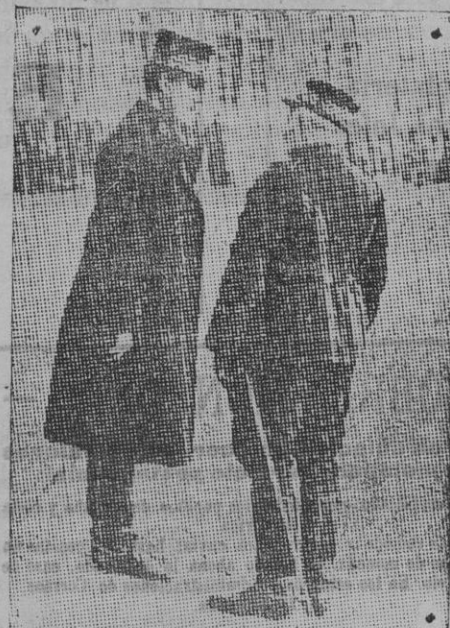
El intrépido Rey de los belgas convesando con un general del ejército francés.

Se ha ampliado hasta el día 24 el plazo para informar ante la Comisión que entiende en el proyecto de ley sobre el trabajo nocturno en la industria de pafinificación.