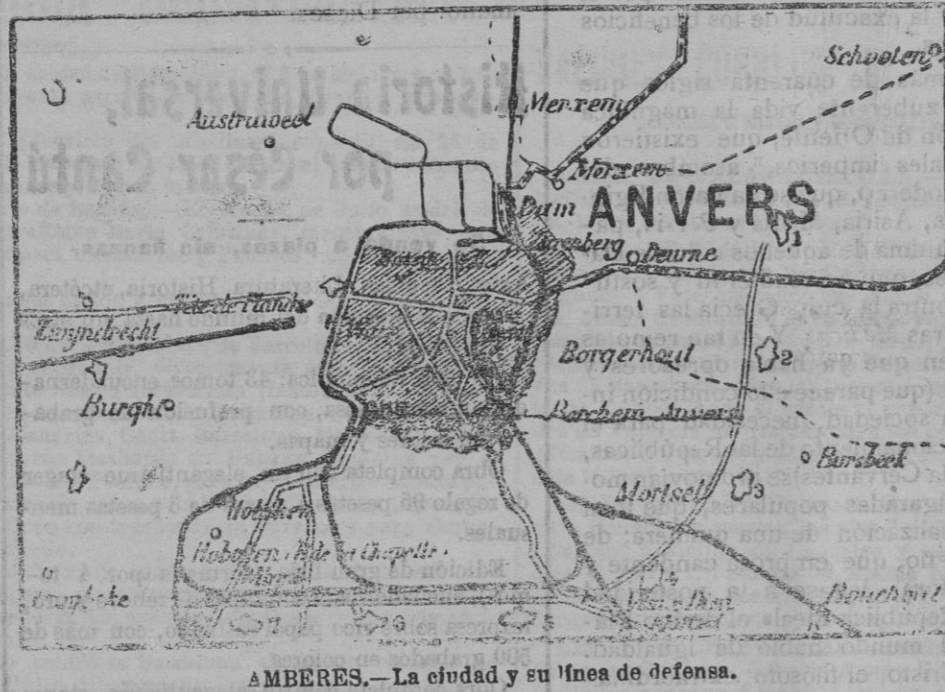
AMBERES.—La ciudad y su línea de defensa.