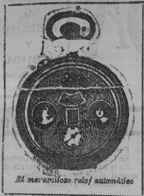
El maravilloso reloj automático