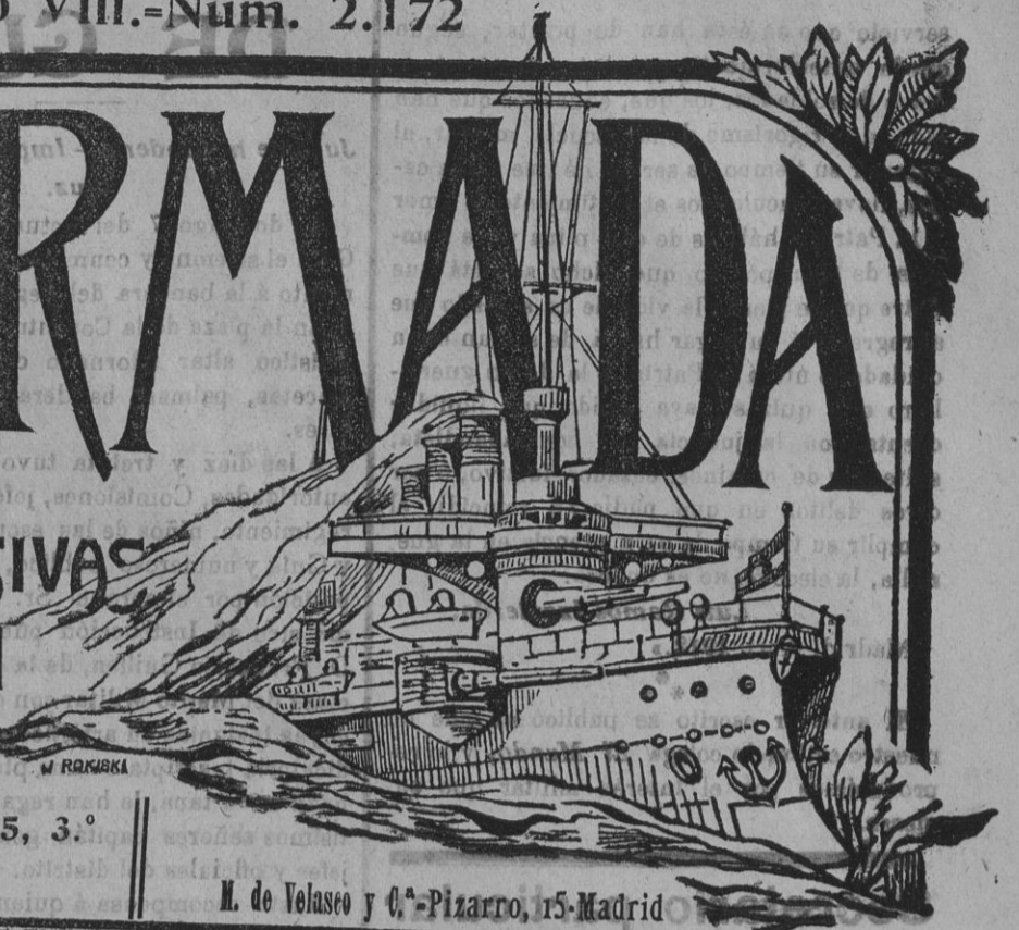
M. de Velasco y C.º-Pizarro, 15-Madrid

REDACCION Y ADMINISTRACION: ALCALÁ, 25, 3.º Apartado núm. 436